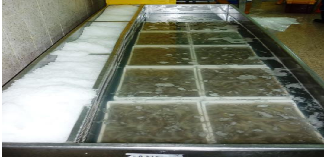
Figura 3. Camarón de calidad listo para la venta.