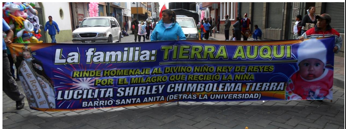
Figura 20. Las familias salen y participan en el pase y ofrecen su baile como ofrenda al niño por los favores recibidos de el en el año.

Grupos de danzas integrados por familias.