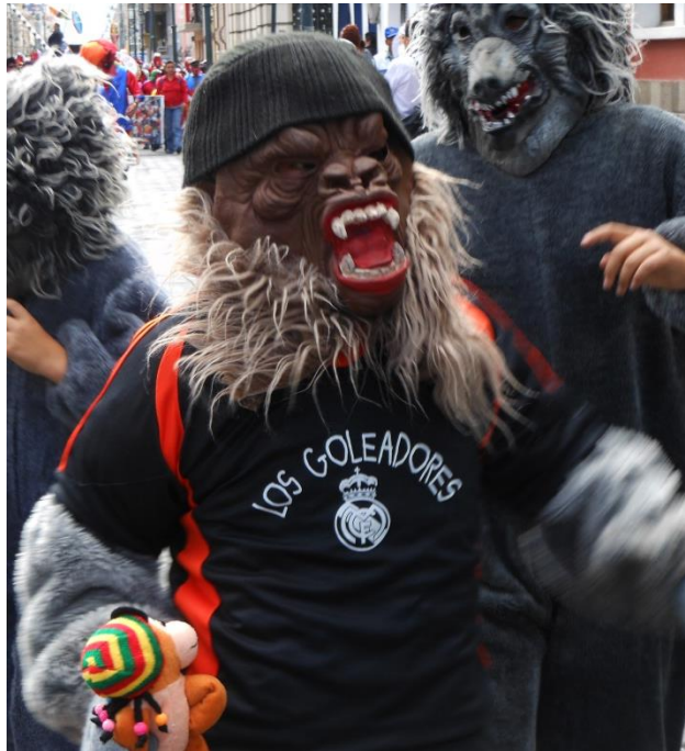
Figura 16. Nombre genérico con que se designa a cualquiera de los animales del orden de los primates no humanos o simios:

Elaborado por: Gabriela Guambo, Jasmin Lens, María Salguero