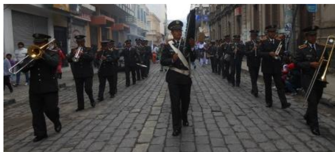
Figura 9. Acompañan al pase al Niño, le da un toque de seriedad respeto y elegancia.

Elaborado por: Gabriela Guambo, Jasmin Lens, María Salguero