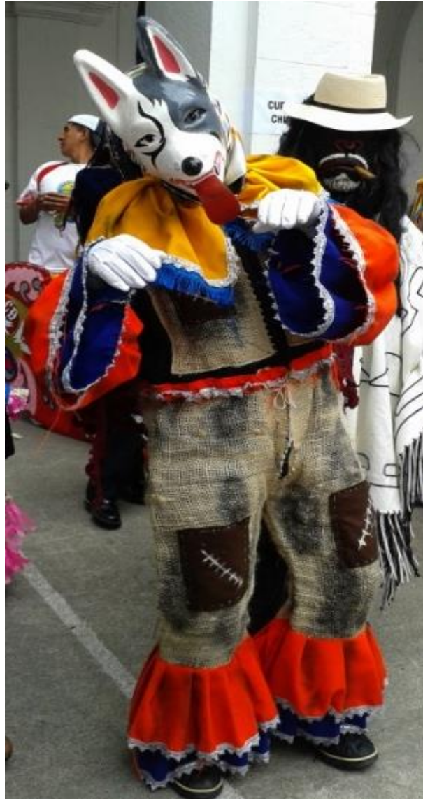
Figura 15. Por su inteligencia y por su fidelidad al ser humano, es tomado en cuenta en el pase.