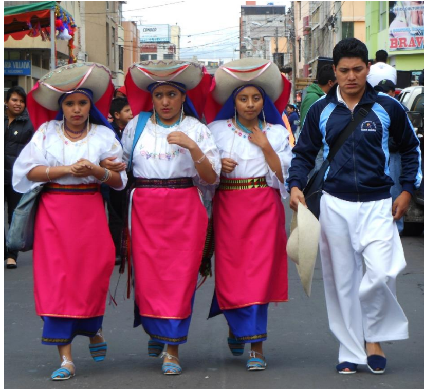
Figura 18. Los grupos de bailarines son contratados por los sacerdotes buscando dar más realce a la fiesta y color.