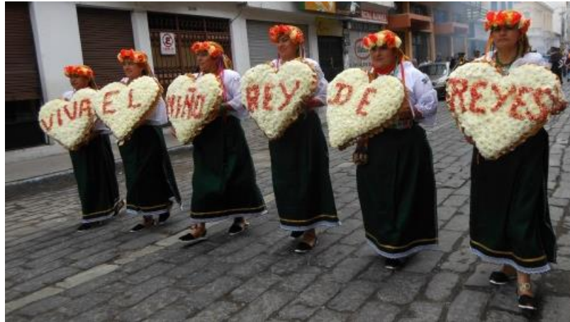
Figura 8. Mujeres que abren el pase del Niño anuncian la llegada del Rey de Reyes.