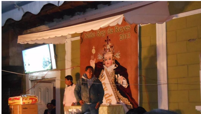
Figura 2. Es la manera como se le conoce al lugar donde se encuentra la imagen del niño, es una casa que dispone de un altar para orar y donde se puede celebrar misas dedicadas hacia él.

Elaborado por: Gabriela Guambo, Jasmin Lens, María Salguero