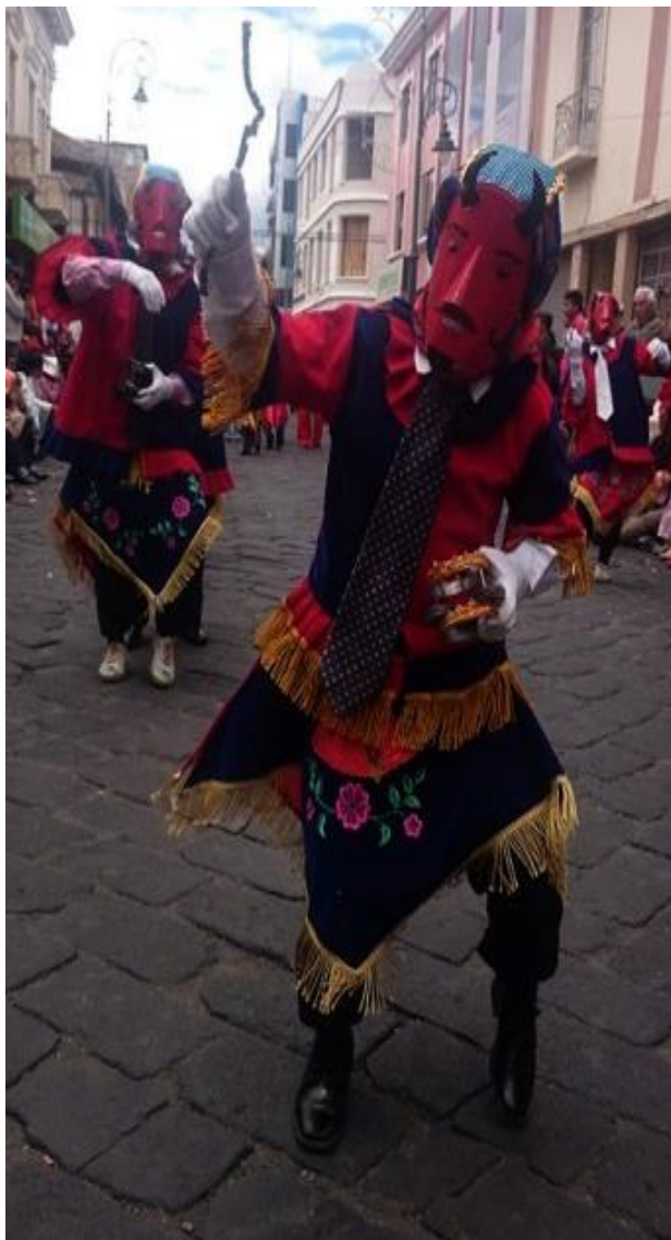
Figura 12. Representan el paganismo popular.