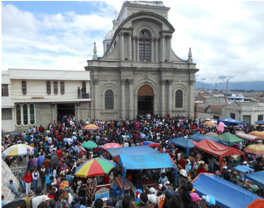
Figura 23. Creyentes que acompañaron en todo el pase al niño se reúnen en la iglesia de la Loma de Quito para escuchar la misa.

Elaborado por: Gabriela Guambo, Jasmin Lens, María Salguero