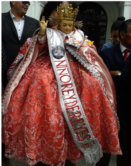
Figura 4. Imagen del Niño en una de sus visitas a Quito.