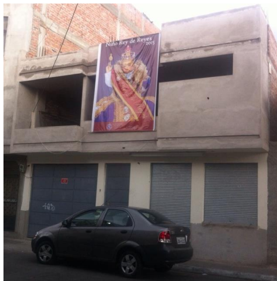
Figura 3. Es el lugar donde se encuentra la imagen del niño, que anteriormente era una casa de adobe de una planta, en la actualidad ha sido remodelada y consta de dos plantas.

Elaborado por: Gabriela Guambo, Jasmin Lens, María Salguero