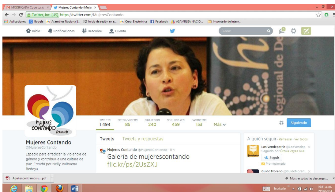
Figura 1. Cuenta Twitter @MujeresContando