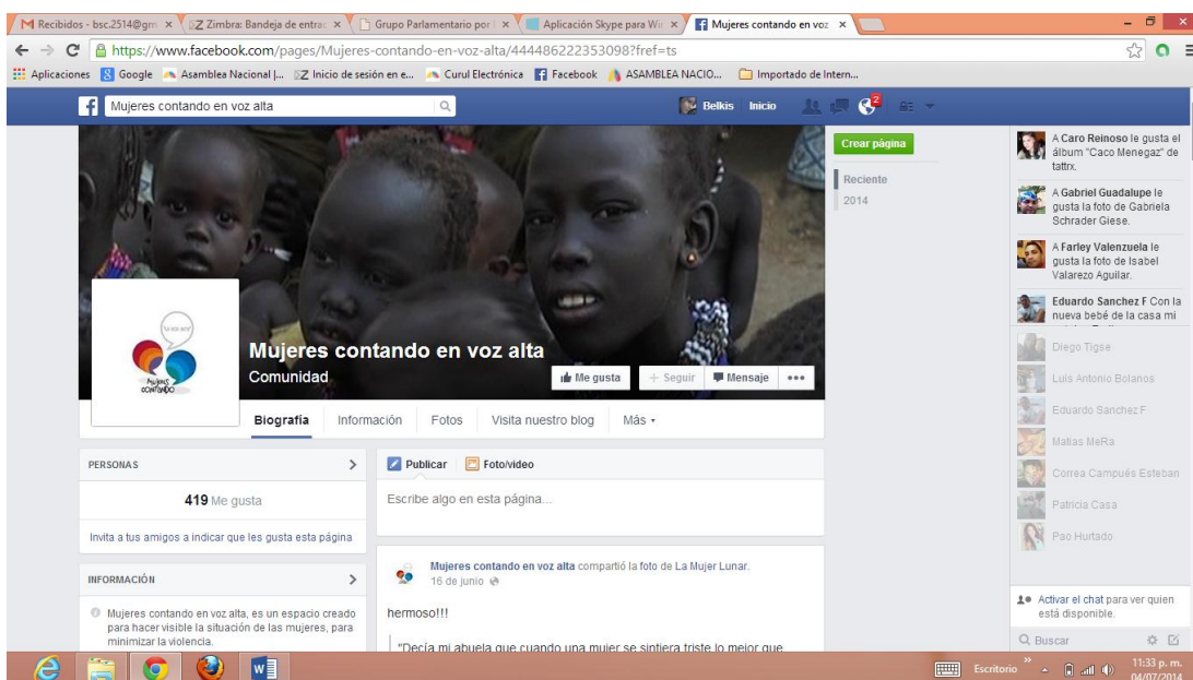
Figura 3. Cuenta Facebook Mujeres contando en voz alta (Ecuador)