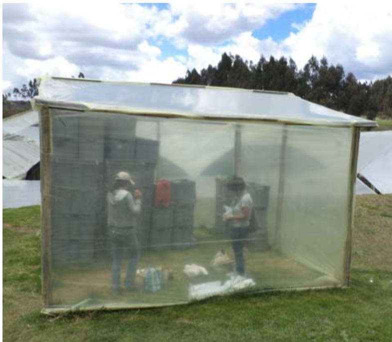
Figura 2. Pequeño invernadero adaptado para la investigación.

A continuación, se mantuvieron por 5 minutos expuestos al aire para eliminar el exceso de humedad y después se colocaron 15 ácaros adultos con la ayuda de un pincel. Las cajas se invirtieron para que los individuos se encuentren en la posición que normalmente adoptan en las hojas.