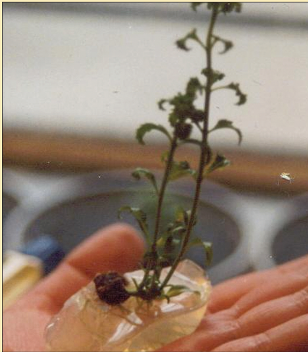
Figura 5. Limpieza de las raíces del medio de cultivo MS.