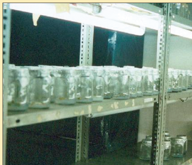
Figura 3. Cámara de cultivo.

Bajo estas condiciones, los frascos con los explantes se trasladaron a una cámara de incubación la cual se mantiene a una temperatura de 25 \pm 2 °C, y bajo una intensidad luminosa de 2.000 lux (lámparas fluorescentes), tal como se muestra en la (Figura 3).