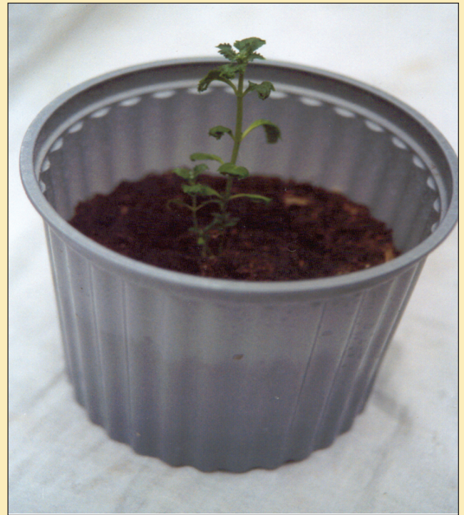
Figura 6. Plantulas de Scoparia dulcis L (SCROPHULARIA-CEAE) en invernadero, después de 15 días.