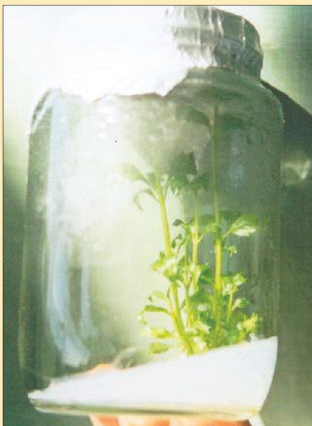
Figura 4. Muestra con desarrollo normal en Cultivo in vitro de Scoparia dulcis L (SCROPHULARIACEAE).

Se halla que el medio de cultivo más adecuado es el de MS (Murashige & Skoog) cuya concentración de elementos se detalla (Tabla 2); además se encontró que no es necesario la adición de hormonas. Se muestra también crecimiento y evolución de los segmentos nodales (Figuras 4, 5 y 6).