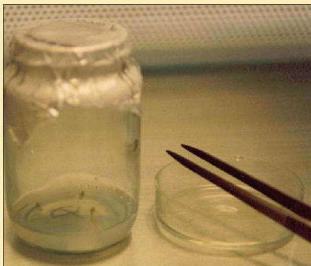
Figura 2. Siembra de segmentos de Scoparia dulcis L en medios de cultivo.