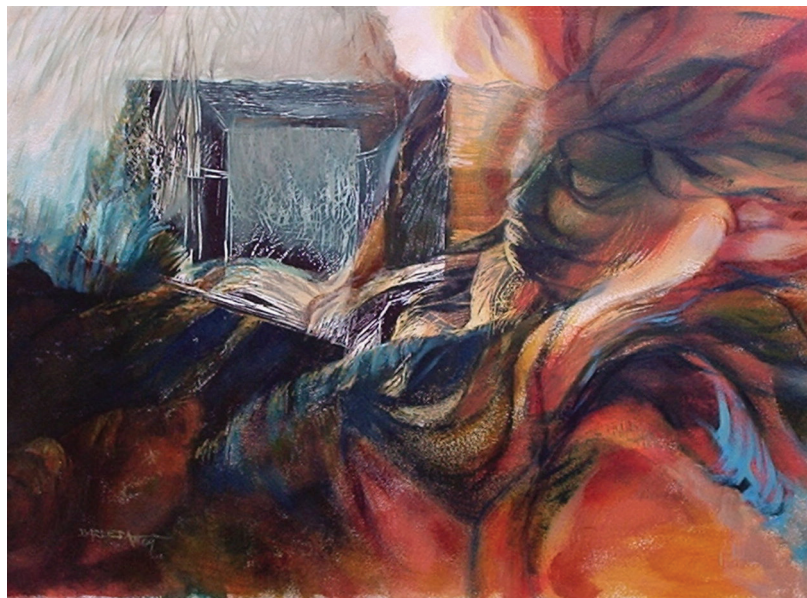
El tiempo que viene, grabado intervenido sobre papel, 45x65

El autor defiende que la formación para la ciudadanía debe considerar el desarrollo de