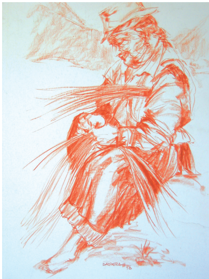
La tejedora de paja, sanguina sobre papel, 100x70

Se percibió que la importancia de la escuela en la vida de estos individuos, más allá de un derecho a ser conquistado, está, también, en la función de prepararlos para la vida en sociedad. La formación integral y la promoción de los derechos de estos jóvenes y adultos son indispensables para la garantía de su ciudadanía. El Colegio Estatal Benta Pereira, como institución perteneciente a la red estatal de enseñanza, sigue la propuesta pedagógica trazada por la SEERJ que, a su vez, cumple con