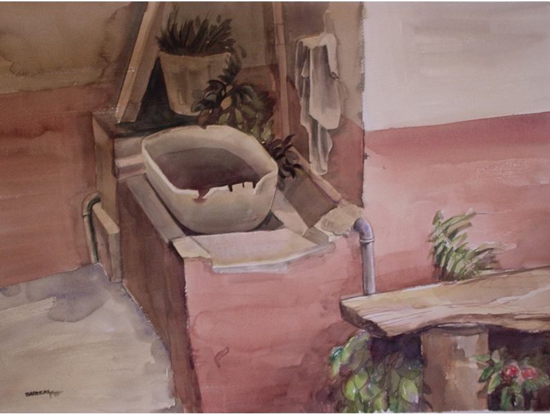
El tanque de agua, acuarela sobre papel, 50x70

de la EJA en el Colegio Estatal Benta Pereira? Al intentar buscar respuestas, se trazaron objetivos generales y específicos, de modo que analicen la experiencia educativa desarrollada con los jóvenes y adultos del Colegio Estatal Benta Pereira, espacio geosocial en el que se desarrolló la investigación, para elaborar una propuesta de mejora de la calidad de enseñanza para los sujetos de aquella institución, a partir de la Pedagogía Salesiana.