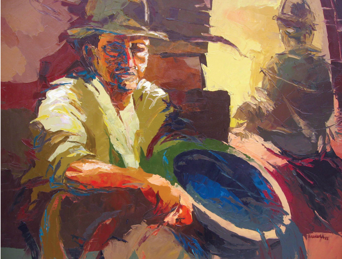
La tina azul, óleo sobre lienzo, 60x80, 2008

La investigación indicó incluso el hecho de que una de las limitaciones sufridas por el Colegio Estatal Benta Pereira para alcanzar la acción educativa que se aproxime a los principios de la Pedagogía Salesiana, se refiere a la dificultad de, como escuela pública, obtener autonomía suficiente para definir en sus propuestas pedagógicas principios que considere adecuados a la realidad de sus estudiantes, más allá de las acciones que efectivamente los preparen para el trabajo.