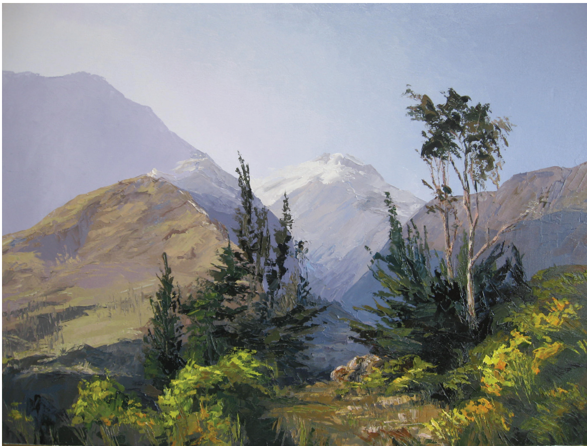
Flores amarillas, óleo, 60x80

y el mundo en el que están insertos, objetiva el desarrollo como ser complejo y global, observando las dimensiones afectivas, cognitivas y sociales. Son: