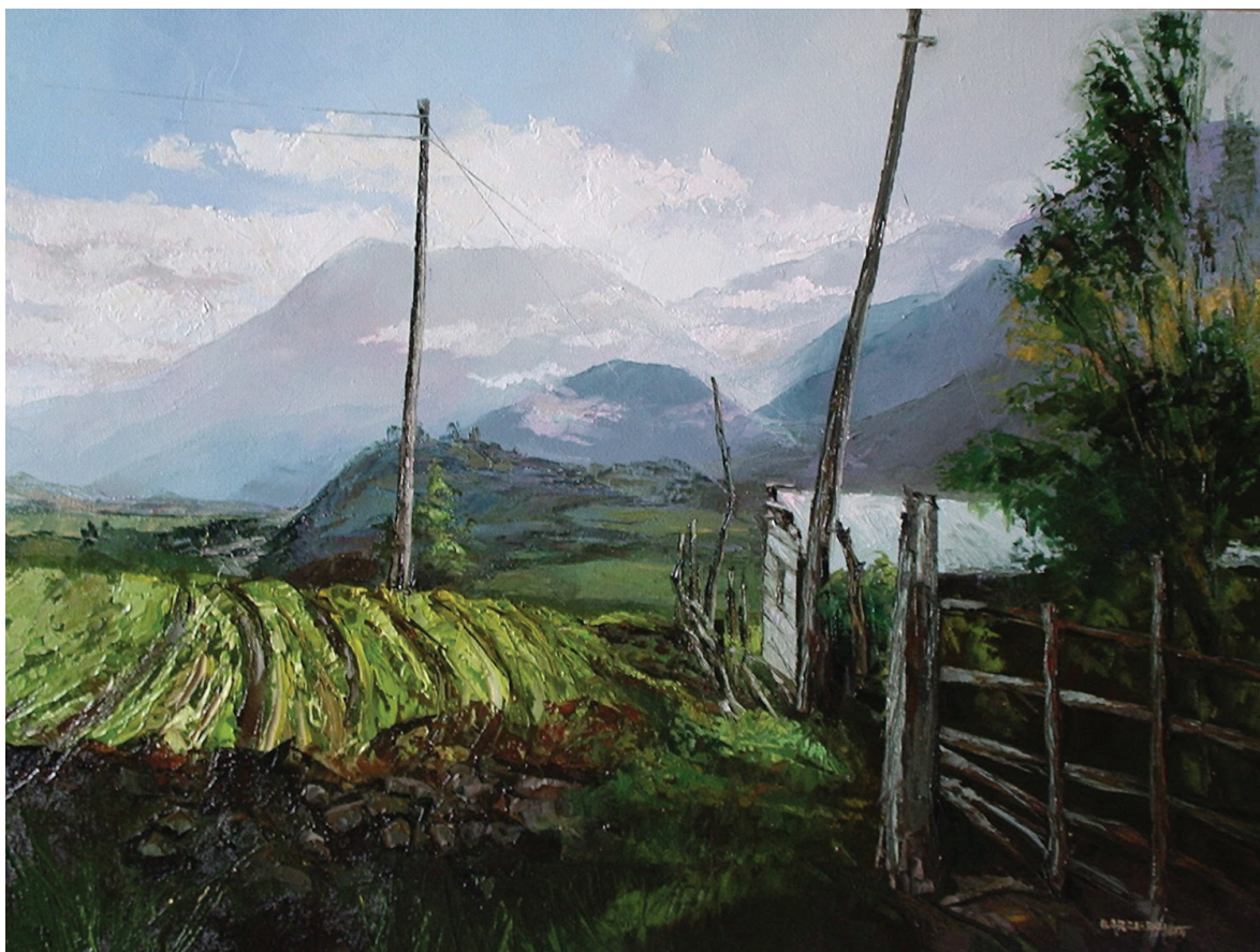
El valle del Patate, óleo, 60x80

tos. Busca insertarlos en la sociedad de modo que, de acuerdo con Ruffinato (2007) se sientan “parte activa por medio del trabajo, de la corresponsabilidad en el bien común y del empeño por una convivencia pacífica” (Chávez, 2008: 19) y, de ese modo, despertar participación honesta y ciudadana en la sociedad. El proyecto educativo salesiano se basa en el humanismo optimista que cree en las potencialidades del ser humano como agente transformador de la sociedad y protagonista de la historia.