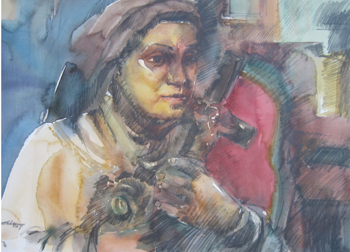
Demostración de fe, acuarela

La Pastoral Juvenil no inventa a los jóvenes, en el nombre de Jesús, los encuentra como son y donde están. La escena de “desertificación espiritual” (usando las palabras de Benedicto) o del “embate” (según el Papa Francisco) en el siglo XXI, es el contexto real y concreto en el cual estamos llamados a trabajar no sólo para los jóvenes sino con los jóvenes y entre los jóvenes.