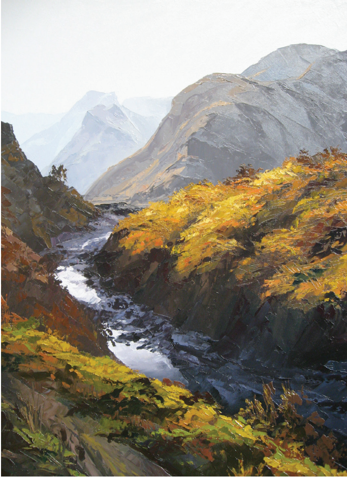
El río seco, óleo sobre lienzo, 80x60

no aisladamente, sino formando un pueblo. No es posible vivir la fe sin la comunidad: en ella se recibe, en ella se celebra, desde ella se es enviado a la misión. La relación pastoral pasa, pues, por la comunidad eclesial.