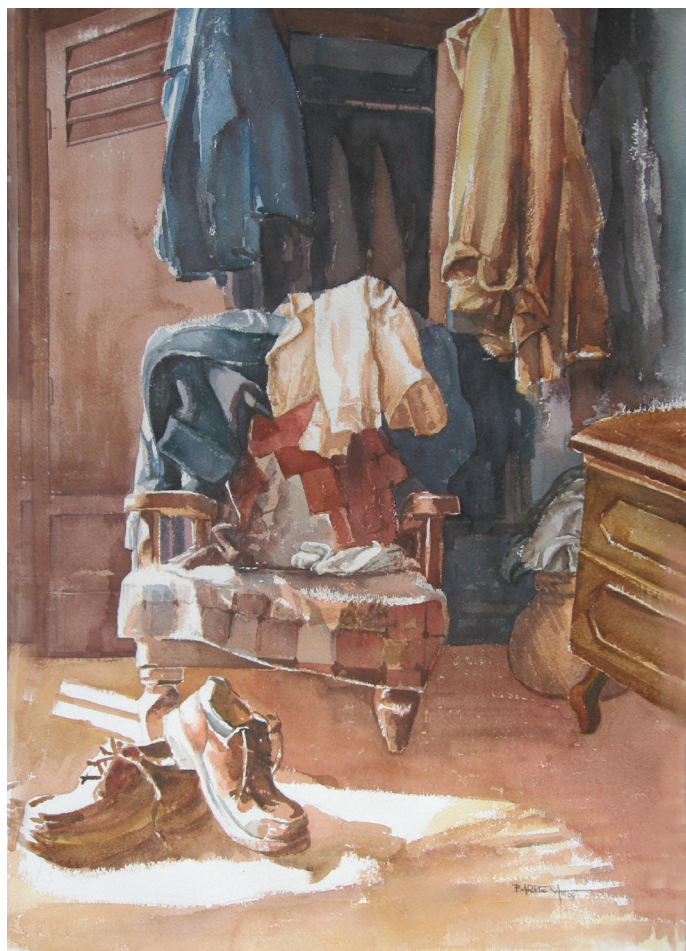
El rincón de las ausencias, acuarela, 70x50

El agente de pastoral está llamado a ser un pedagogo de la comunicación. Quiere y busca que el mensaje se haga vida. En Jesús tenemos siempre el modelo, el camino, la vida. Como el Maestro Bueno, cada agente de pastoral deberá