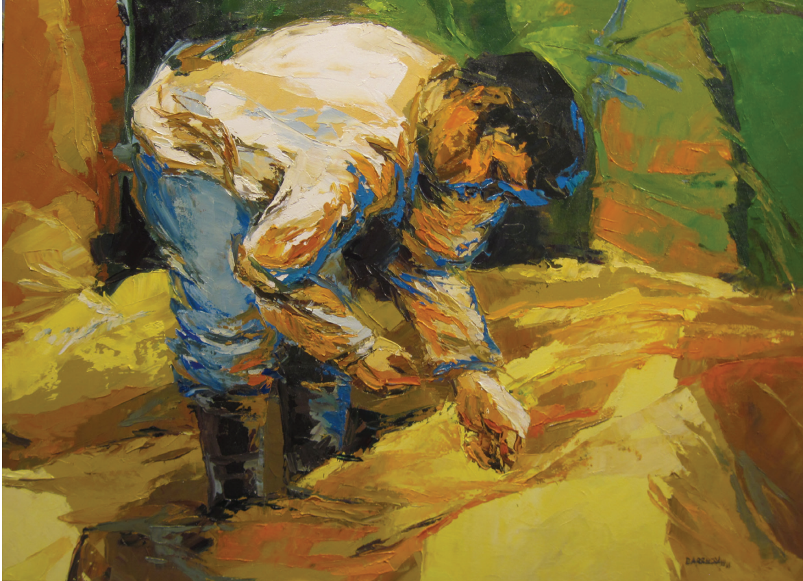
El sembrador, óleo sobre lienzo, 60x80

pide acogida de amor y de discernimiento de la Palabra para no confundirlo con las propias fantasías. Que inicia un proceso vivo, existencial. Luego esta vivencia no deja igual a la persona, la cambia y la lanza a la misión. La misión es un movimiento que no para jamás, que lleva más allá de las fronteras, a todos los rincones. El kerigma es anuncio testimonial, que está en la base, por eso es primer anuncio. Es el anuncio fundamental, aquello sin lo cual lo demás quedaría en el aire. Busca generar la vida de fe. Es la invitación a recibir a Jesús como Salvador y Señor, pero es un anuncio trinitario, porque se habla de Cristo como enviado del Padre con la fuerza del Espíritu. Este anuncio es una invitación emotiva y cordial porque se dirige al corazón, a ese centro donde se toman las decisiones existenciales y definitivas. Hay que tener puntería, hay que disparar al corazón. No es una invitación a aprenderse algo con la cabeza sino a decidirse por Alguien. Es un anuncio que suscita una profunda emoción (Hch. 2, 37). Un anuncio vivido comunitariamente, que funda la Iglesia.