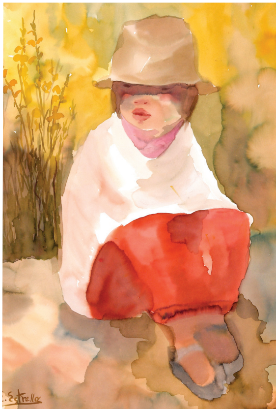
La pastora (acuarela)