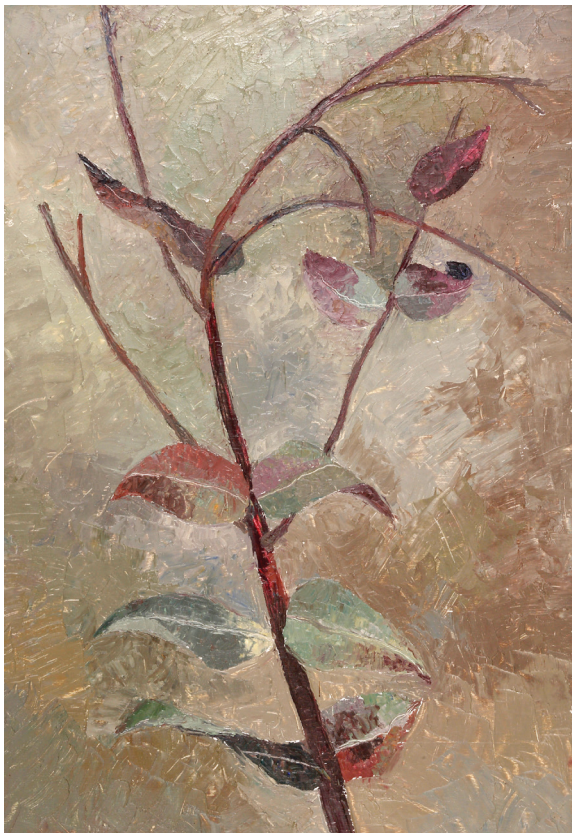
Rama de eucalipto (óleo)

dispositivo grupal planteado nos llevó a motivar a los estudiantes permanentemente en la búsqueda de apoyo psicológico individual si creían necesitarlo. Luego de la experiencia, algunos de ellos fueron a trabajar de manera individual sus conflictos.