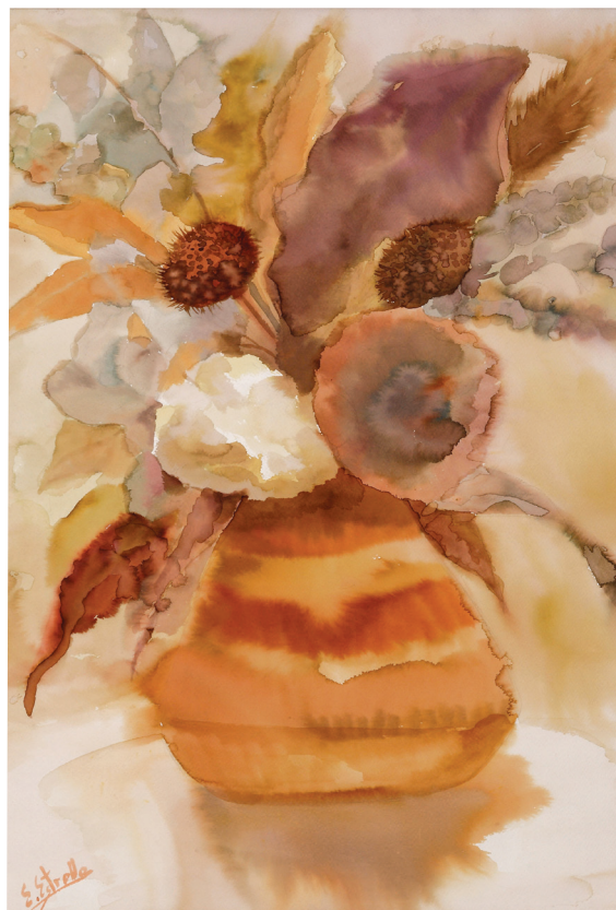
Flores secas (acuarela)