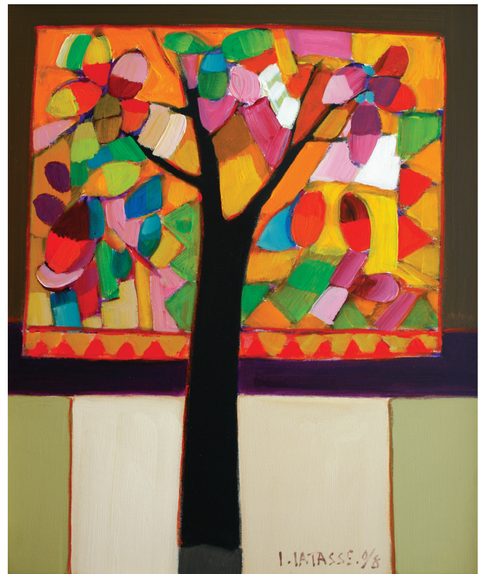
Serie Árbol de la vida - Verano. Acrílico sobre lienzo. 2008

Estas aproximaciones resultan pertinentes como modelos analíticos que permiten ligar tan-