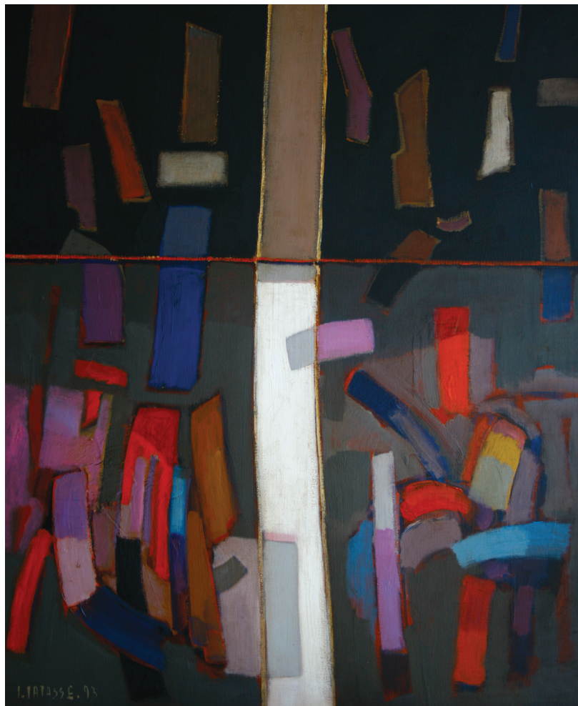
Serie Símbolos del hombre. Acrílico sobre lienzo. 1993