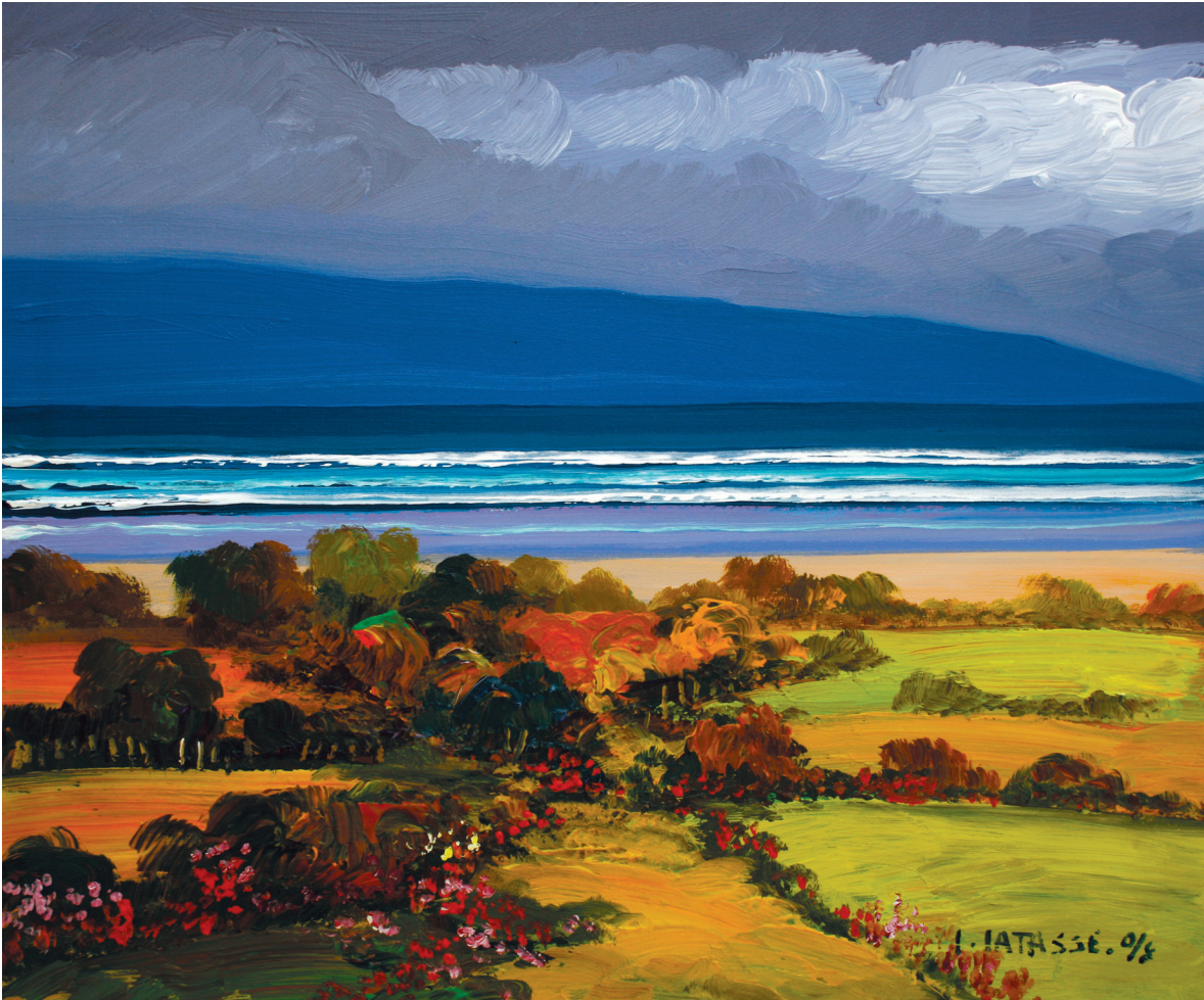
Serie Marina. Acrílico sobre lienzo. 2008

to la acción cotidiana en los procesos de apropiación espacial como las dinámicas concretas de acción colectivas desplegadas en un proceso participativo de transformación del espacio público a escala de barrio.