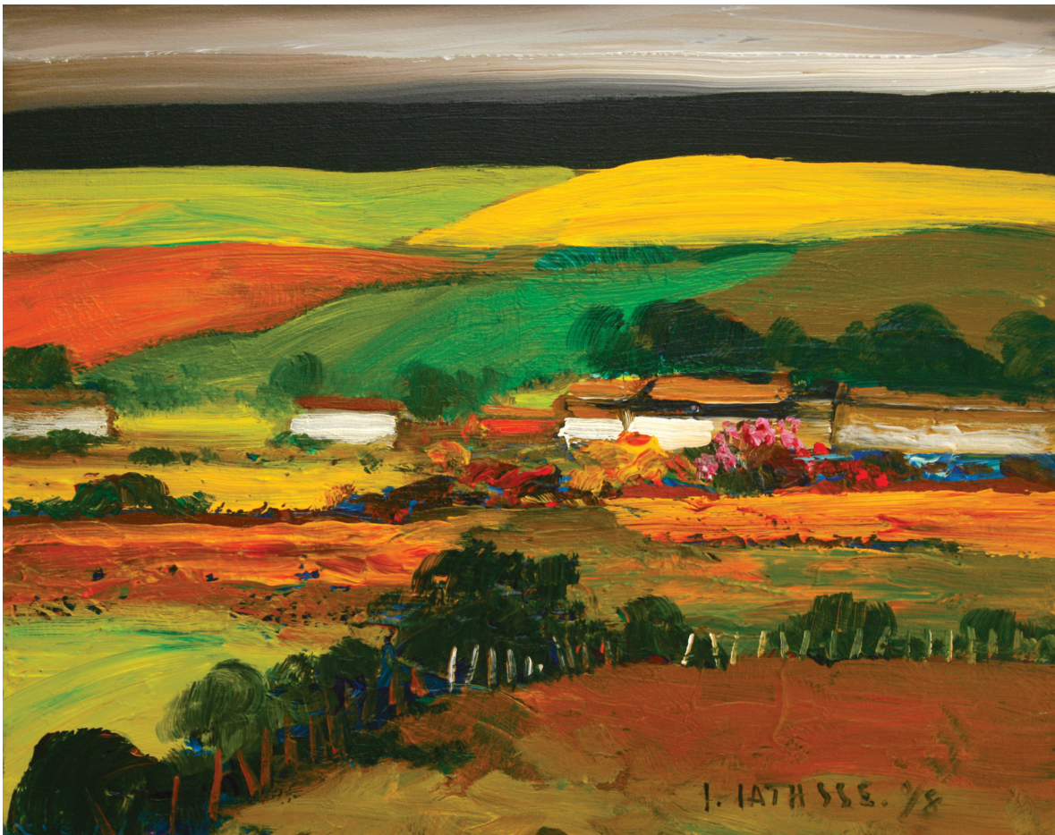
Serranía. Acrílico sobre lienzo. 2008

A este respecto, compartimos con Vidal (2008), la idea de que en la gestión de los soportes comunicativos (planos, fotografías, maquetas, dibujos, tarjetas escritas, textos escritos, interacciones verbales, software, etcétera) hay una oportunidad para facilitar el diálogo y la colaboración en el diseño de un espacio público. Los diversos soportes comunicativos, no sólo facilitan la conversación entre profesionales, sino que se consti-