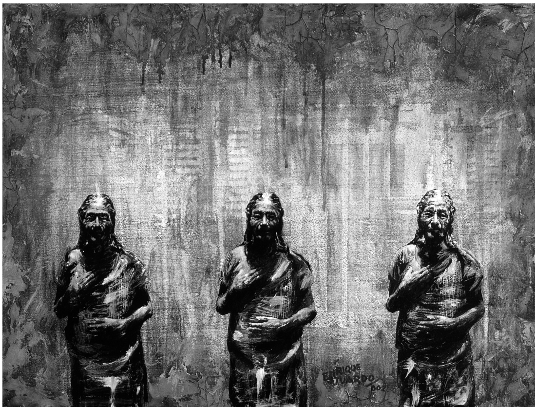
Urbana 2. Técnica mixta sobre tela. 2001