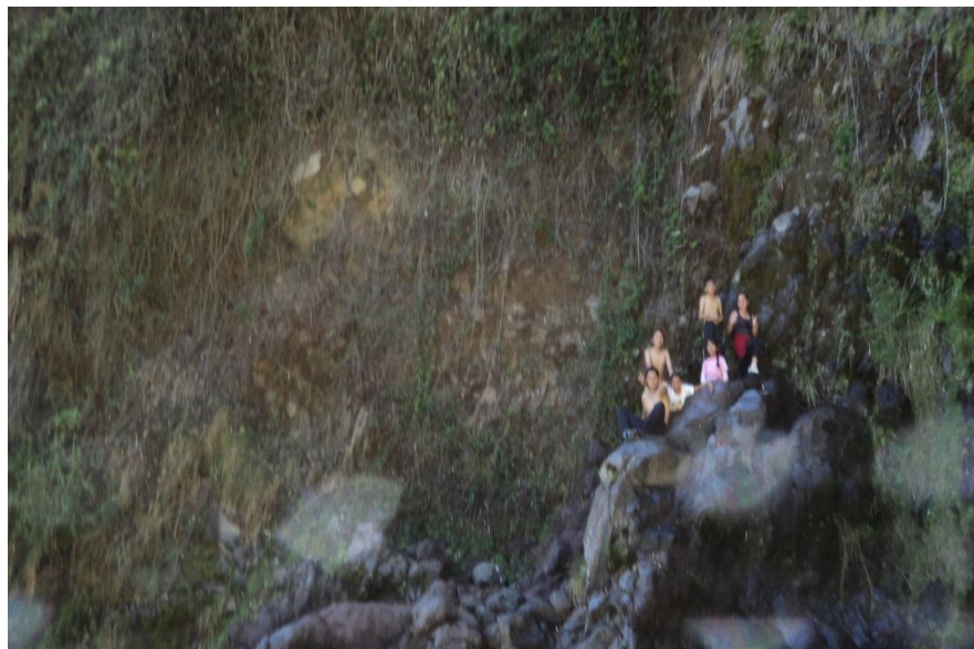
Figura16: El paseo fue desarrollado como un acto de compromiso simbólico respecto al convenio interinstitucional entre el Centro de Investigación Psicosocial de la Universidad Politécnica Salesiana y el Comité de Desarrollo Comunitario Los Pinos, además que sirvió como un ejercicio de transición de la primera fase de pertenencia influencia, hacia la segunda fase de integración y satisfacción de necesidades.

Elaborada por: José Nicanor Bohórquez Vargas