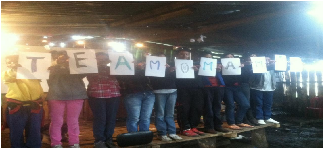
Figura21: Esta actividad tiene una inmensa importancia, ya que fue la primera actividad que la OJU realizó desde principio a fin, es decir desde la idea, los recursos, la organización, la convocatoria, absolutamente todo fue realizado desde la OJU sin ayuda de los adultos, ni del guía.