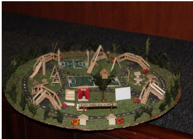
Figura18: La maqueta nace del diseño participativo del parque de los sueños de la OJU, como símbolo de praxis sobre un diseño a pequeña escala, es mostrar a los ejecutores del diseño participativo que se puede realizar.

Elaborada por: José Nicanor Bohórquez Vargas