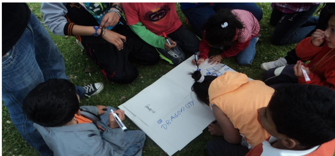
Figura 3. Ejercicio diagnóstico donde los niños, niñas y jóvenes escribían en cualquier lugar del pliego de papel las actividades semanales que deseaban realizar en el proyecto.

Elaborada por: José Nicanor Bohórquez Vargas