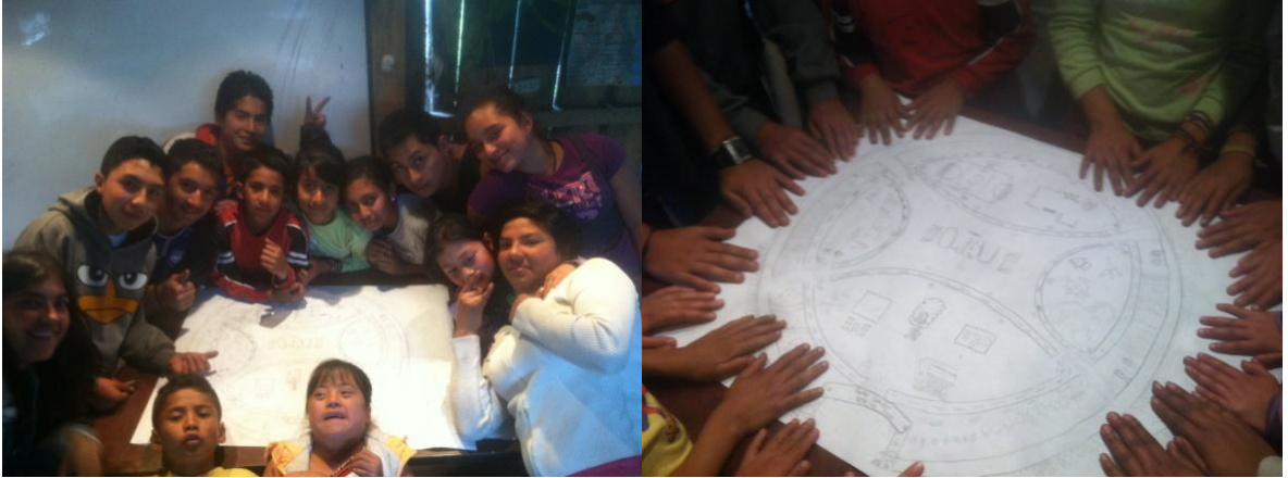
Figura17: La producción obtenida a través del diseño participativo refleja todo el trabajo realizado por la OJU entorno a la construcción del sentido de comunidad.

Elaborada por: José Nicanor Bohórquez Vargas