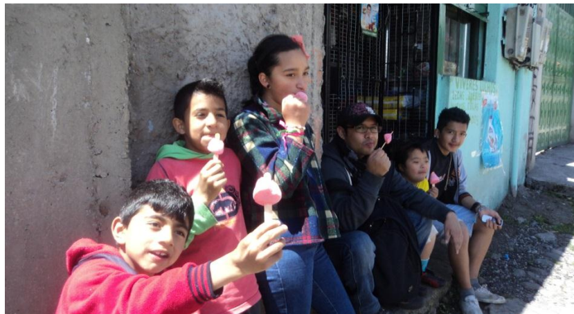
Figura 2. Regalarles helados, simbolizó las ganas de los agentes externos de dar o entregar algo a través del proyecto.

Elaborada por: José Nicanor Bohórquez Vargas