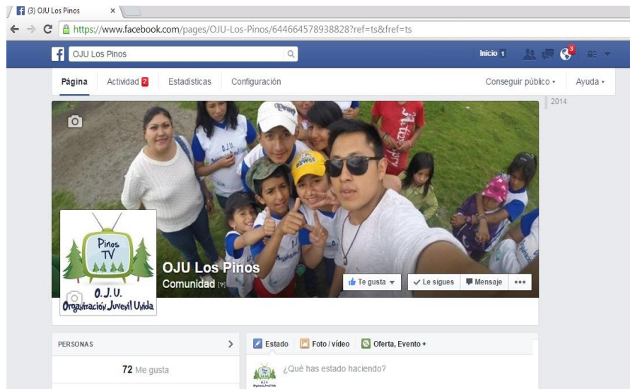
Figura19: Es una forma de difusión y promoción para la OJU.