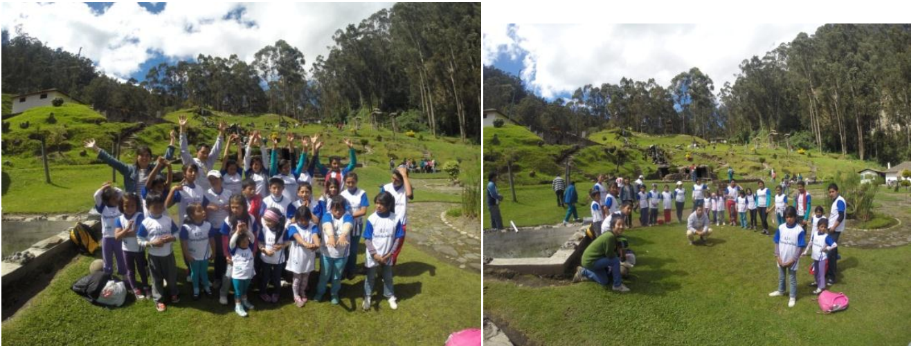
Figura22: Este paseo fue el tercero que se realizó durante el primer año del proyecto, fue un paseo para consolidar el grupo de alrededor de 25 niños, niñas y jóvenes que la OJU logró conformar e integrar.

Elaborada por: José Nicanor Bohórquez Vargas