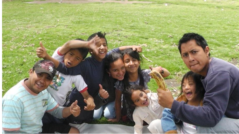
Figura 1. Compartiendo y comiendo juntos fue un ejercicio de integración, sencillo, informal y divertido con niños, niñas y jóvenes de la comunidad, sirvió para fortalecer la relación y el proceso de familiarización.

Elaborada por: José Nicanor Bohórquez Vargas