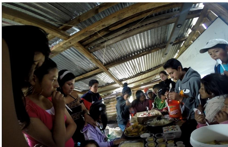
Figura23: El primer aniversario de la OJU, fue un momento muy esperado y se lo realizo de manera sencilla pero llena de profundidad en cuento a análisis y reflexión del futuro de la OJU.

Elaborada por: José Nicanor Bohórquez Vargas