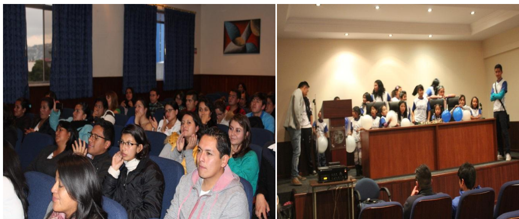
Figura24: Este evento de gran importancia fue realizado en el Auditorio Monseñor Leónidas Proaño de la Universidad Politécnica Salesiana y cambio totalmente la rutina de exposición académica, ya que en este caso los beneficiarios, los niños, niñas y jóvenes fueron los actores principales, fueron los expositores y el centro de la dinámica.

Exposición del proyecto construcción del sentido de comunidad en niños, niñas y jóvenes del barrio san José los pinos dentro del proceso de legalización de tierras, desde la OJU.