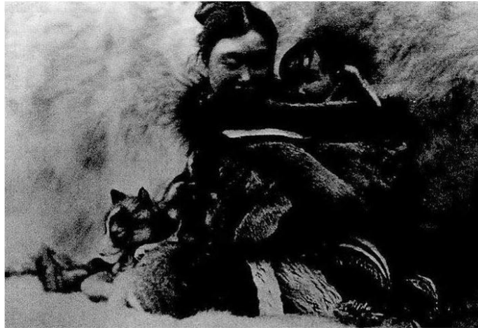
Ilustración 2: Nanook. Una familia a la que alimentar. (Rabiger, 2005)

Utiliza ángulos picados y contra picados y una gran cantidad de panorámicos mostrando la belleza de un paisaje de hielo