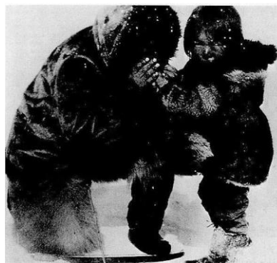
Ilustración 1 Nanook calentando las manos de su hijo, perteneciente a Nanook el esquimal. (Rabiger, 2005)

En la película se muestra un Nanuk como un personaje tierno que vive en paz en su familia que para los demás son considerados seres salvajes, en esa época los esquimales eran vistos como personas retrasadas e ignorantes, pero Flaherty muestra a un hombre y mujer trabajadores que viven en paz y crían con cariño a sus hijos como si fueran una familia normal de la ciudad.