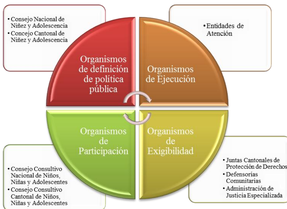
GRÁFICO 1: Sistema Nacional Descentralizado de Protección Integral a la Niñez y Adolescencia (SNDPINA)