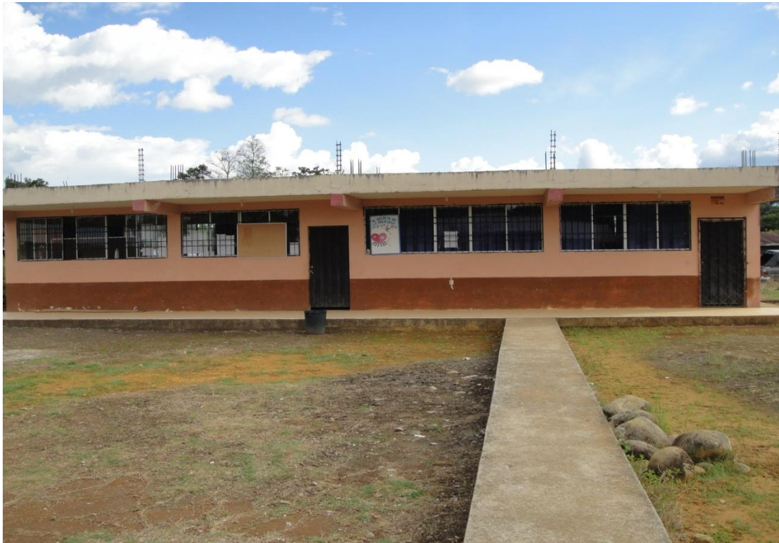
Bloque de aulas de cemento, aulas de educación Inicial y laboratorio de computación del Centro Educativo “Francisco de Orellana”