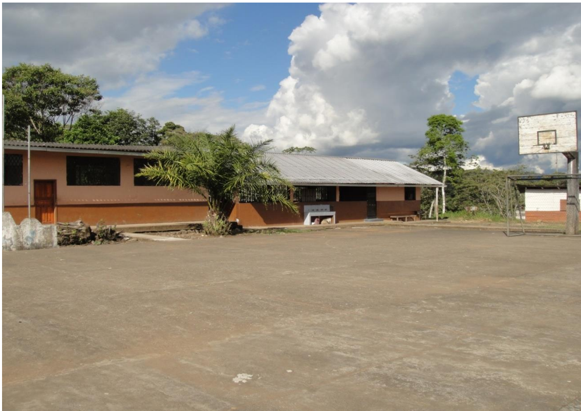
Bloque de aulas de cemento, cancha de uso múltiple, cocina y comedor del Centro Educativo “Francisco de Orellana”