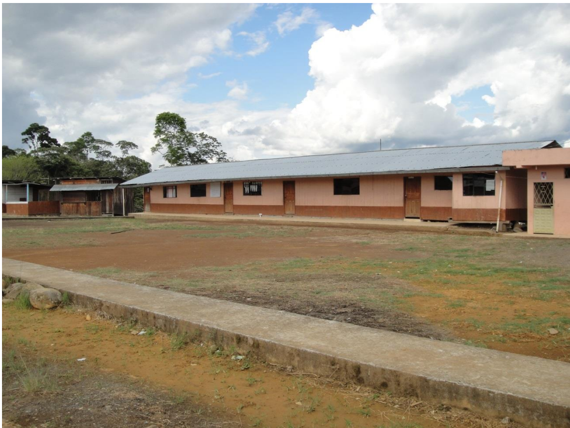
Bloque de aulas de madera del Centro Educativo “Francisco de Orellana”

El Centro Educativo cuenta con la siguiente infraestructura 4 aulas de cemento, 1 aula de computación de cemento, 7 aulas de madera, 1 comedor de cemento, 1 cocina de cemento, 2 bares de madera, 2 baterías sanitarias de cemento, 1 cancha de fútbol de tierra, 2 canchas pequeñas de tierra y 1 cancha de cemento