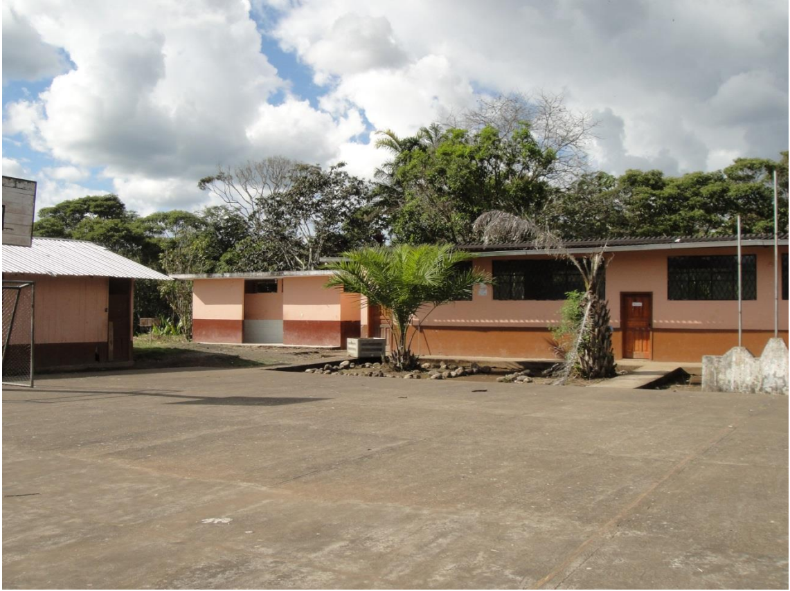
Baños y un bloque de aulas de la institución