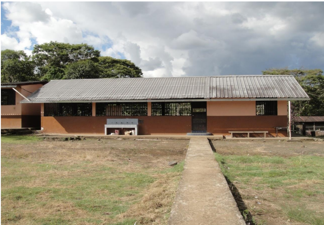
Comedor y cocina del Centro Educativo “Francisco de Orellana”