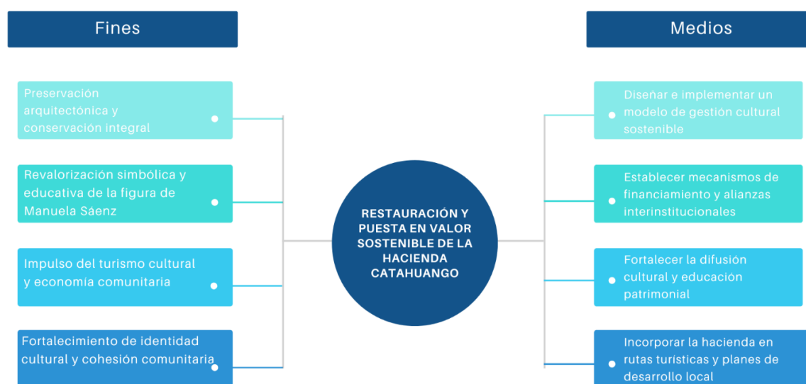
IMAGEN 1. ARBOL DE OBJETIVOS

Este objetivo plantea una solución estructural al problema central identificado: el deterioro y subutilización de un bien patrimonial relevante para la memoria histórica del Ecuador. La propuesta va más allá de la simple recuperación arquitectónica: se trata de dotar al espacio de un sentido funcional, simbólico y comunitario, articulando diversas estrategias de conservación, participación y sostenibilidad económica.