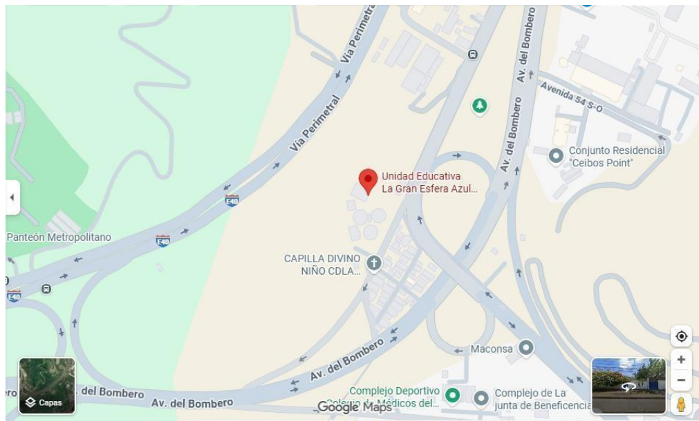
Figura 1 Croquis de referencia

Av. Abdón Calderón Muñoz Km 7 ½, de la provincia del Guayas de Ecuador.