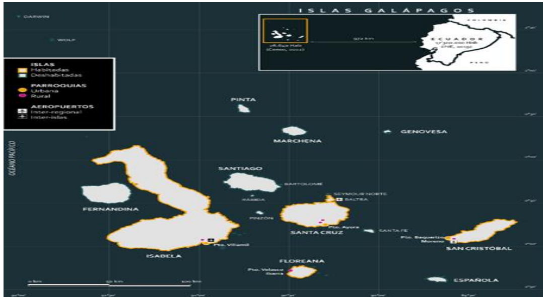
Figura 1 Mapa del archipiélagos de Galápagos

Del mismo modo la parroquia rural Tomás de Berlanga perteneciente al cantón Isabela tiene 174 hombres, representa el 59.0%; mujeres 121 cuyo resultado es 41.0%, dando como total 295 habitantes (Instituto Nacional de Estadística y Censo, 2022).