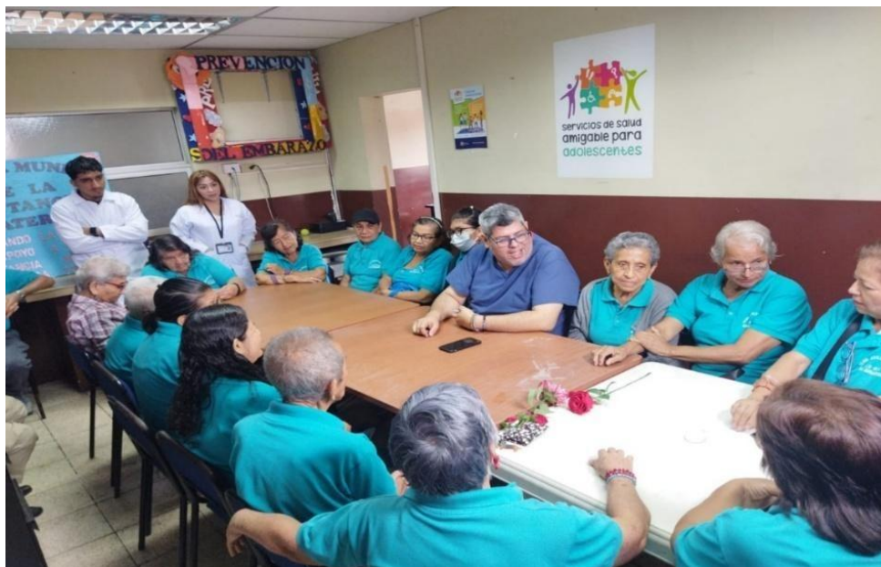
Ilustración 10: Reflexión sobre la utilidad de la dinámica lúdica para la estimulación de la memoria y la atención.