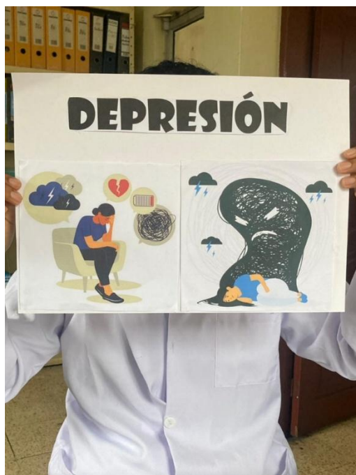
Ilustración 6: Material de apoyo para charla psicoeducativa acerca de la depresión.