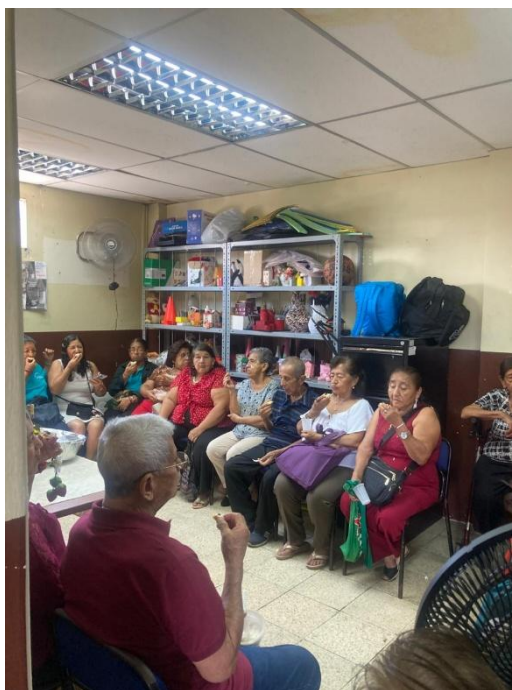
Ilustración 3: Compartir de alimentos con los adultos mayores.