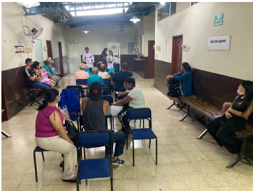
Ilustración 4: Charla psicoeducativa acerca de la depresión y el suicidio.