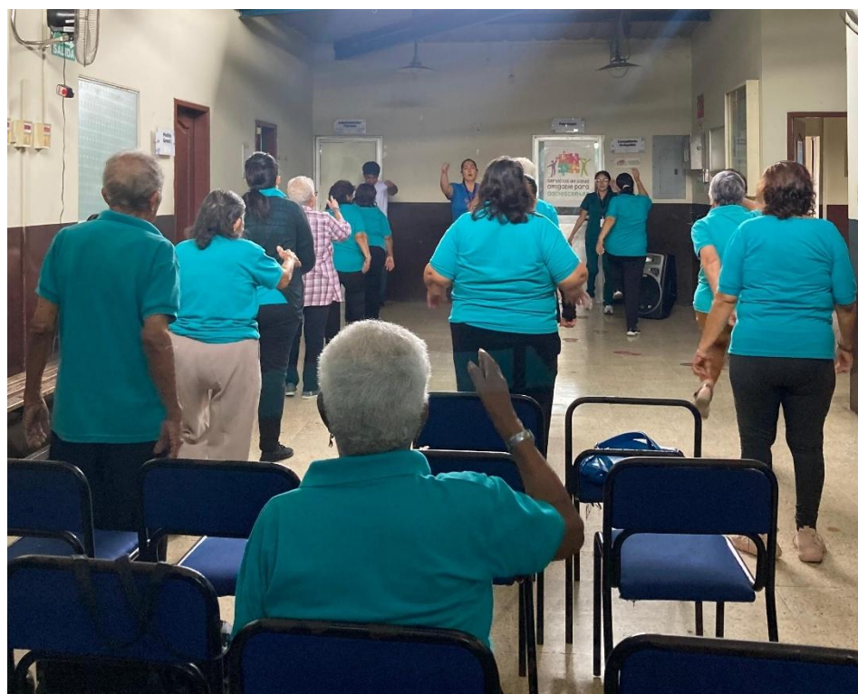
Ilustración 11: Participación de los adultos mayores en el taller de ejercicios rítmicos y corporales.