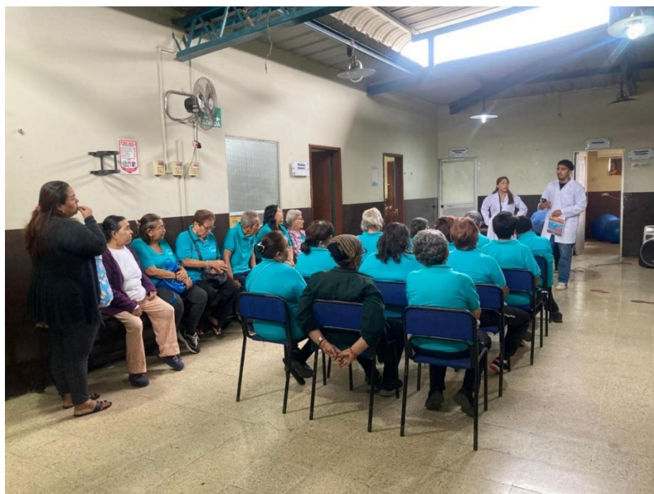
Ilustración 14: Charla psicoeducativa sobre el tema de la violencia.