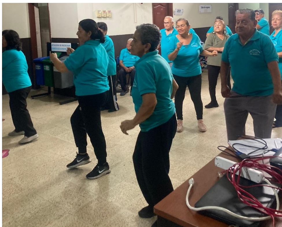
Ilustración 13: Segunda sesión de bailoterapia con los adultos mayores.