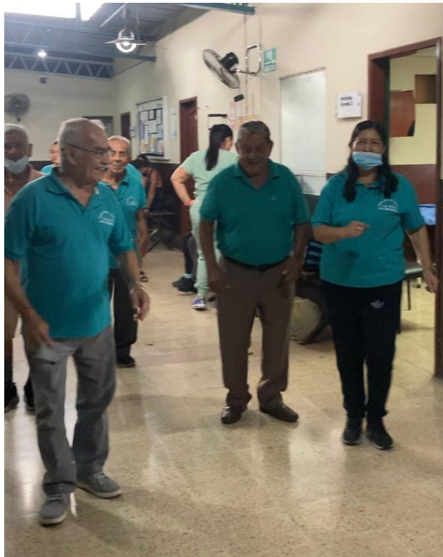
Ilustración 7: Primera sesión de bailoterapia con los adultos mayores.