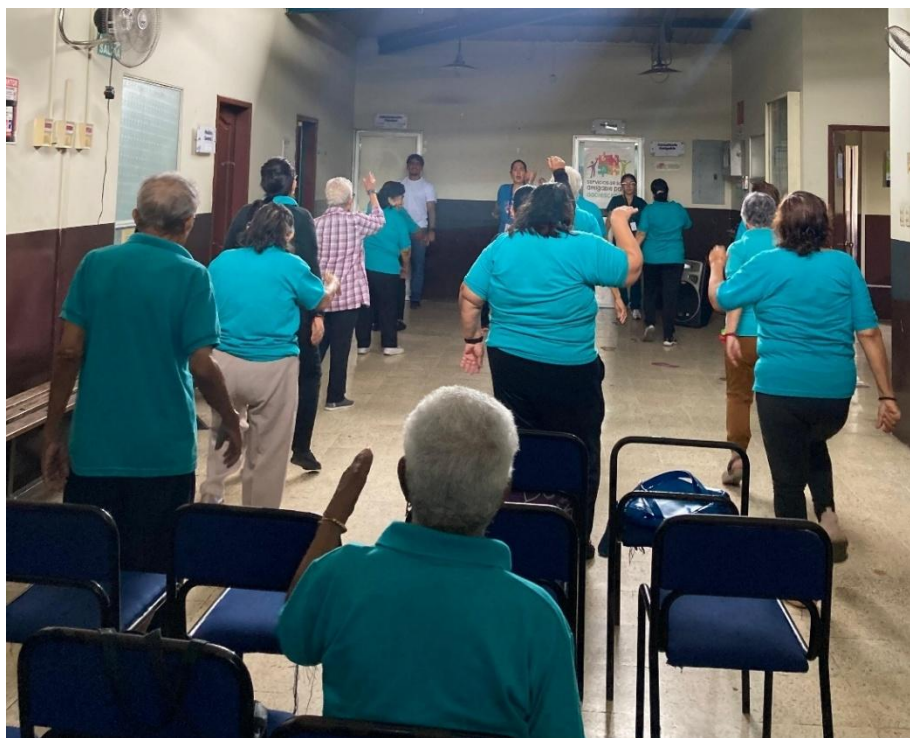
Ilustración 12: Participación de los adultos mayores en el taller de ejercicios rítmicos y corporales.