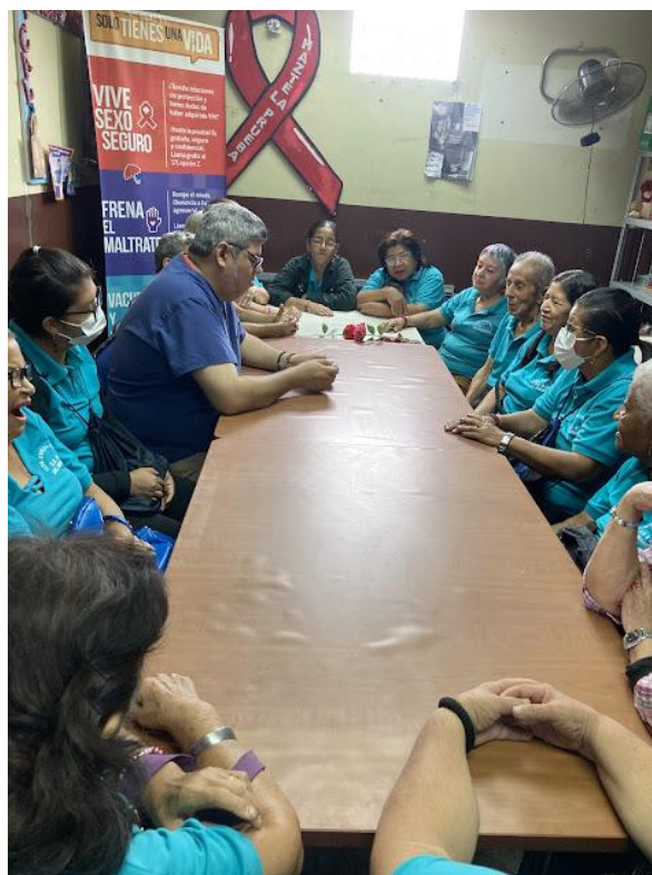
Ilustración 9: Dinámica lúdica con barajas para la estimulación cognitiva de los adultos mayores.