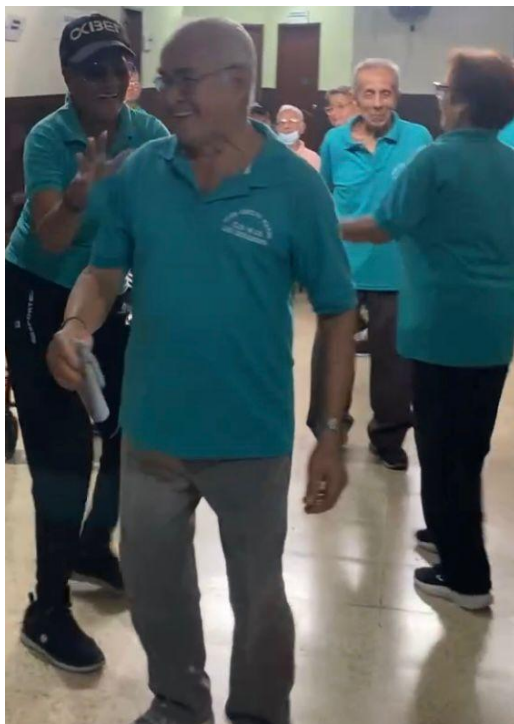
Ilustración 8: Interacción social entre los adultos mayores en la primera sesión de bailoterapia.