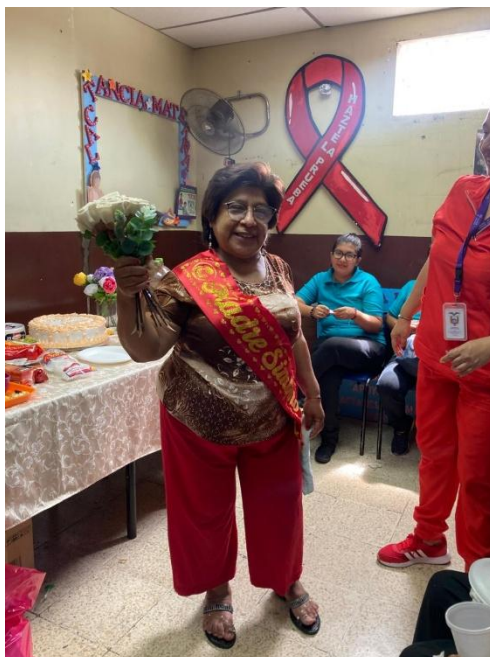
Ilustración 2: Conmemoración del día de la madre.