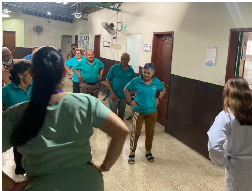
Ilustración 15: Implementación de técnicas de relajación y regulación emocional.