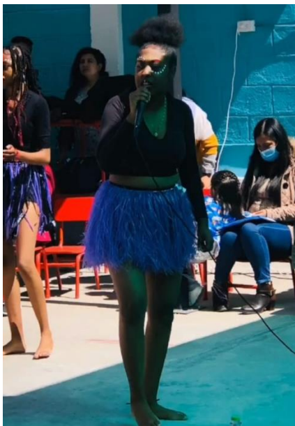
Gráfico 3. Falda hecha con paja plástica

Cada vez tenían más presentaciones en el colegio y también se sumaban más integrantes al grupo, pero ya no era solo conformado por mujeres sino también por hombres afroecuatorianos y mestizos, esto los llenó de orgullo y ganas para seguir con ese maravilloso proyecto. Después de tres años de mucho trabajo por parte de las estudiantes y el licenciado encargado del grupo les llegó una invitación para desfilan en las fiestas patronales del barrio Moran y gracias a su esfuerzo y dedicación lograron mandar a hacer trajes para bailar bomba para cada integrante del grupo de danza ese día desfilaron y muchos más jóvenes se unieron al grupo. El grupo tuvo un gran impacto y después de aquella