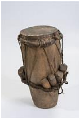
Gráfico 4. Instrumento Musical Cununu

El grupo fusiona instrumentos ancestrales como la marimba, el bombo, el cununu y el guasá con instrumentos y afinaciones modernas. ya que las marimbas tradicionales constan con una afinación propia, según su constructor. Al llevar a cabo nuestra fusión, el objetivo no es que se pierdan las tradiciones, sino más bien ponerlas en un contexto del presente que las haga relevantes y accesibles para las nuevas generaciones. Esta mezcla no solo enriquece nuestro repertorio, sino que también abre nuevos caminos para la música tradicional, permitiendo que el público se conecte y conozca un poco más de esta cultura.