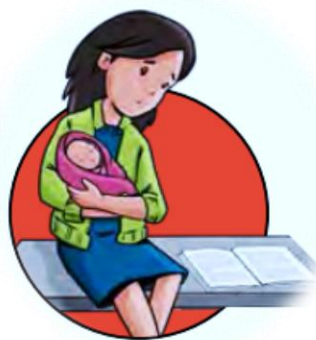
Figura 1 Impacto educativo

En la Zona 6, sobre todo en la ruralidad y entre los pueblos de zonas geográficamente dispersas, las jóvenes se topan con más obstáculos que dificultan su formación académica, tales como la lejanía de las escuelas, la carencia de instalaciones apropiadas y la expectativa social de que sean madres a edades muy jóvenes.