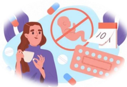
Figura 2. Actuación institucional frente al embarazo adolescente

Finalmente, una dimensión fundamental del proyecto es promover la autonomía de los adolescentes. A través de espacios de participación juvenil, el MSP promueve el liderazgo juvenil en actividades de prevención, transformándolos en agentes de cambio en sus comunidades. Esto fortalece su autoestima y autonomía, a la vez que establece redes de pares que ayudan a prevenir situaciones de riesgo y a romper el ciclo de silencio y desinformación.