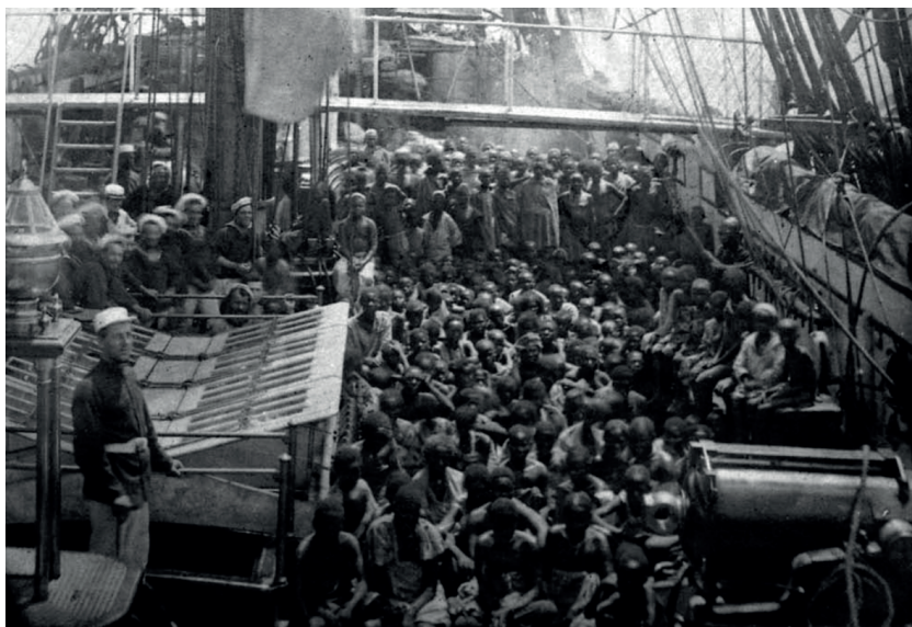
Nota. Esclavos rescatados llenan la cubierta del buque británico HMS Daphne, 1868.

que los indígenas. Estas creencias fueron promovidas por figuras como Nicolás de Obando y Fray Bartolomé de las Casas, quienes abogaron por la importación de esclavos africanos, sistema que se cimentó legalmente con las Leyes de Burgos en 1512 y que se enfocaba en la protección de los indígenas, pero no extendía los mismos derechos a los africanos (Benítez y Garcés, 2014).