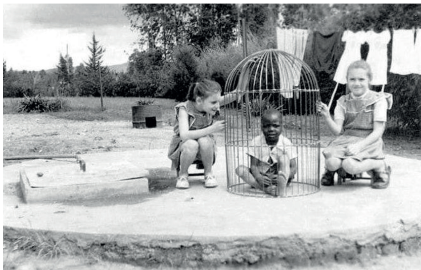
Nota. Un padre trajo a un niño africano en una jaula a sus hijos para entretenerlos, 1955.

Desde el siglo xvi la orden de los mercedarios jugó un papel fundamental en la evangelización de Esmeraldas y de la costa ecuatoriana en su conjunto. Las iglesias más antiguas de la región rinden homenaje a la Virgen de la Merced, protectora de los cautivos y patrona de los mercedarios, quienes fueron los principales agentes religiosos en la zona.