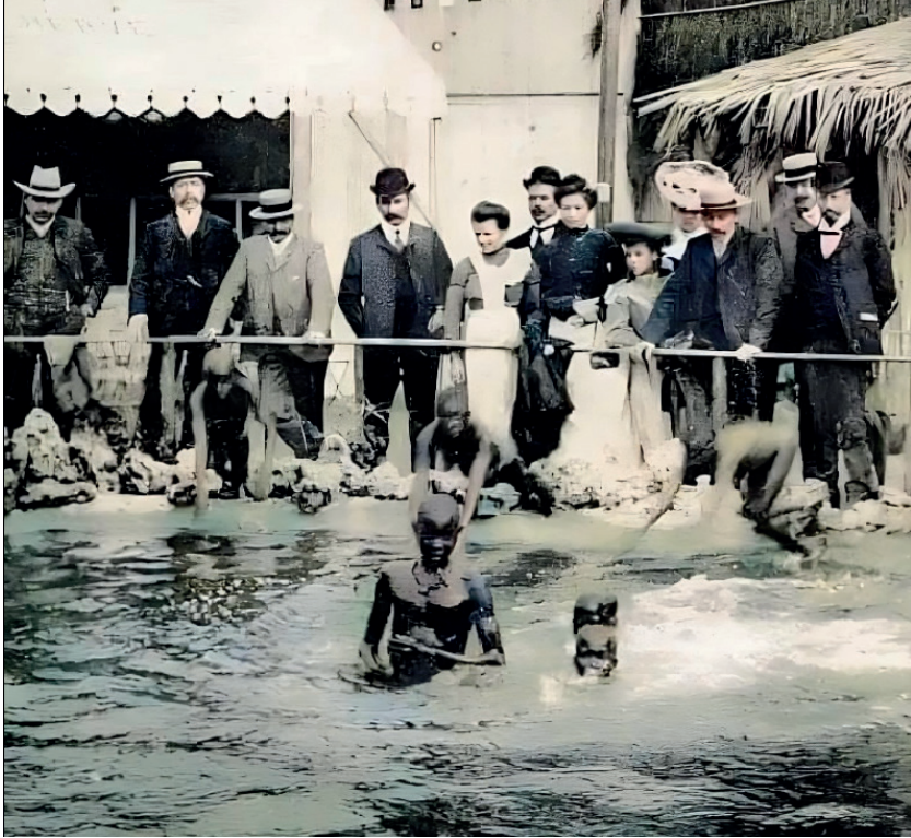
Nota. Zoológico humano en París, 1905. Tomado de Datos Históricos, 2025.

69 ciudadanos y fue el acontecimiento que dio la pauta para reconocer el 21 de marzo como Día Internacional contra el Racismo (en Torres, 2022).