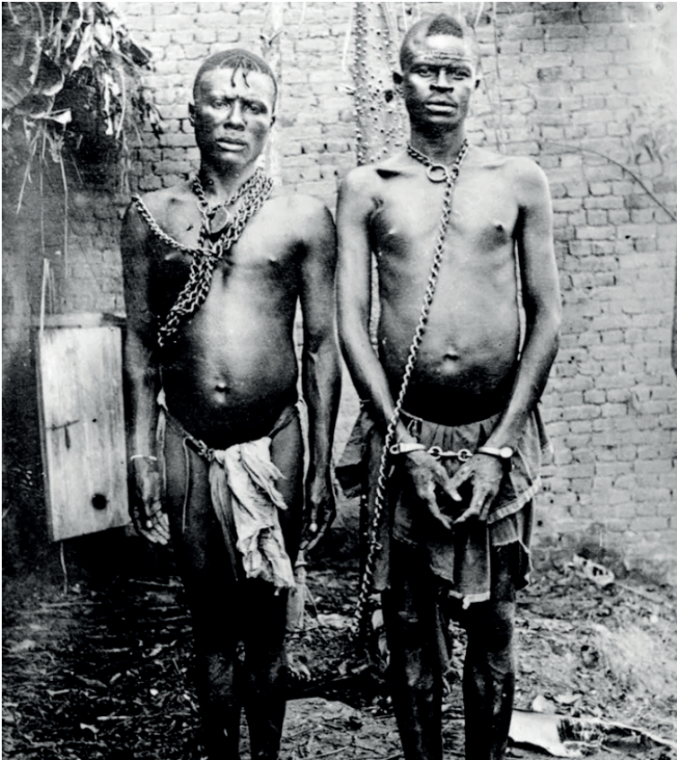
Nota. Esclavos encadenados en el Congo Belga.