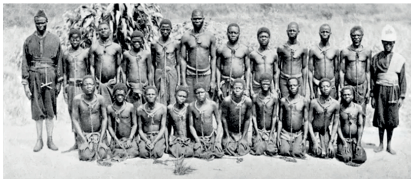
Nota. Prisioneros en el Estado Libre del Congo, durante 1905.

Los esclavos se asentaron en un pueblo indígena llamado Pidí, y de la unión entre estos esclavos, indígenas y algunos colonos blancos surgieron generaciones de zambos, mulatos y mestizos que conformaron una mezcla cultural y social que caracteriza a la provincia de Esmeraldas hasta el día de hoy. Alonso de Illescas, además, no solo aprendió la lengua local, sino que también enseñó a los aborígenes tácticas de guerra, lo que consolidó alianzas estratégicas que permitieron la supervivencia y el crecimiento de esta comunidad.