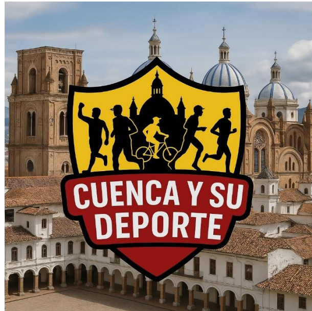
Imagen del podcast