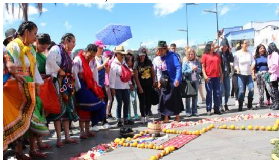
Gráfico motivador, haciendo alusión al nombre del círculo y sus contenidos:

ISKAYNIKI YACHAYMUYUY “Punansuyu llaktakuna.” CÍRCULO DE CONOCIMIENTOS No. 2 “Pueblos de la Sierra”