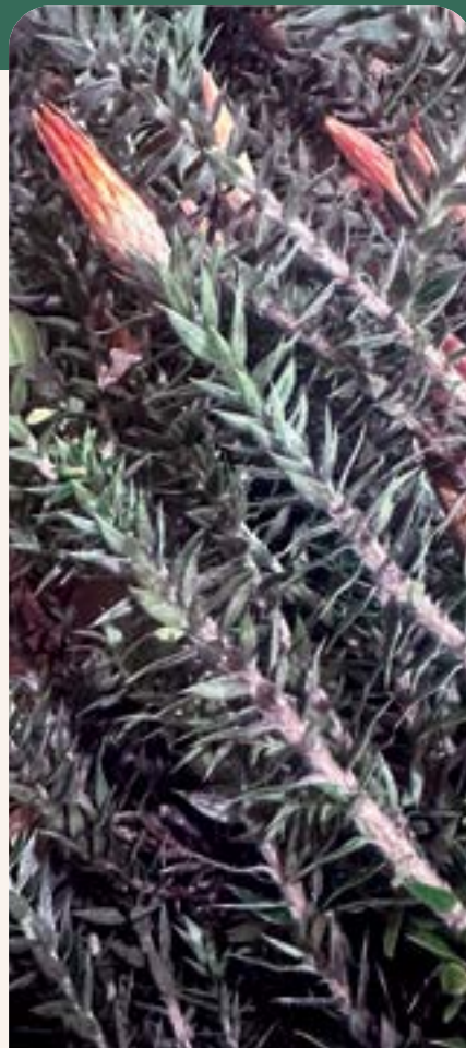
ILUSTRACIÓN 86 Chuquiragua jussieui / Chuquiragua

Uso: resfriados y chiri tabardillo, afección diurética.