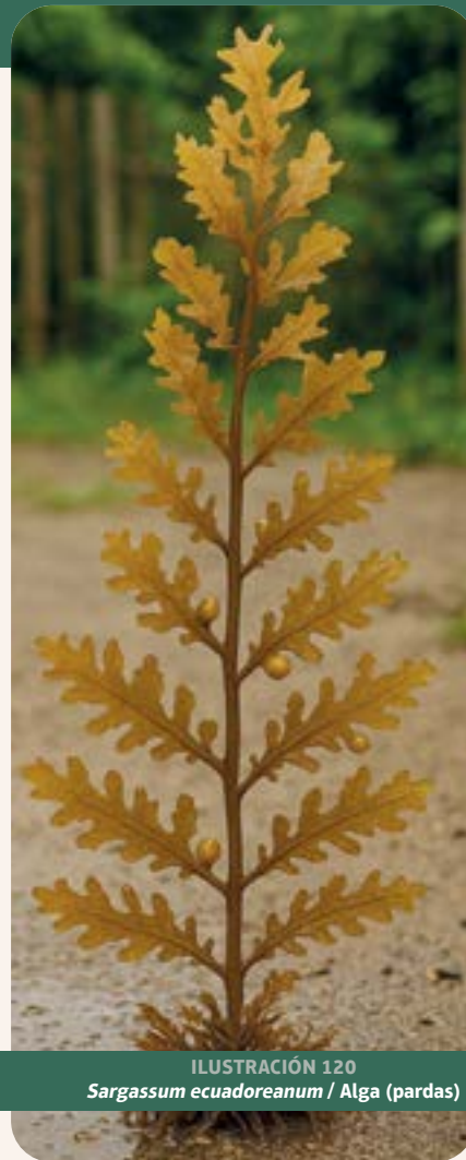
ILUSTRACIÓN 120 Sargassum ecuadoreanum / Alga (pardas)

Uso: posee funciones antioxidantes, antimicrobianas y antiinflamatorias que pueden tener un efecto en la reducción del colesterol, la presión arterial, ayudar en la digestión y el control del peso.