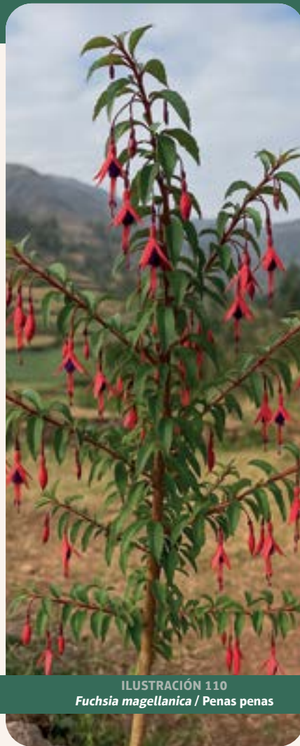
ILUSTRACIÓN 110 Fuchsia magellanica / Penas penas

Uso: la información proporcionada por la comunidad indica que se usa para nervios y sustos; además, las flores maceradas curan infecciones y lastimados de la piel. Tradicionalmente es utilizada como diurético y febrífugo.