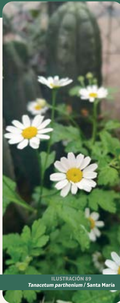
ILUSTRACIÓN 89 Tanacetum parthenium / Santa María

Uso: diurético. Ensayos clínicos controlados han mostrado que extractos estandarizados en parthenolida reducen la frecuencia e intensidad de migrañas (Pareek et al. , 2011).