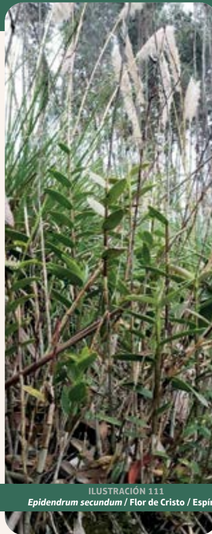
ILUSTRACIÓN 111 Epidendrum secundum / Flor de Cristo / Espiritu

Uso: la información proporcionada por la comunidad indica que se usa para trata nervios, depresión, estrés, cáncer, problemas del corazón, susto, taquicardia y limpia los riñones. Es empleada por comunidades indígenas para tratar inflamaciones y como planta ornamental.