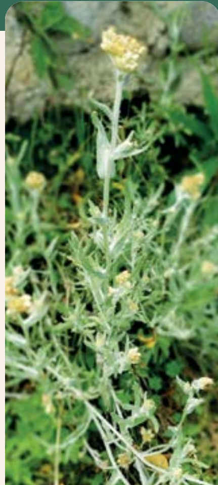
ILUSTRACIÓN 87 Gamochaeta americana / Lechuguilla

Uso: inflamación de riñones, irritación de los ojos, resaca, gripe, gangrena, dolor de muelas, tos y fiebre.