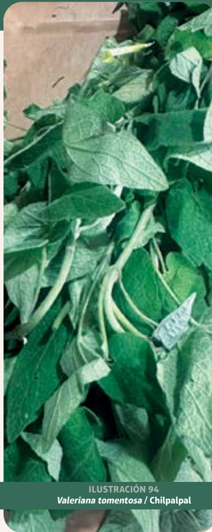
ILUSTRACIÓN 94 Valeriana tomentosa / Chilpalpal