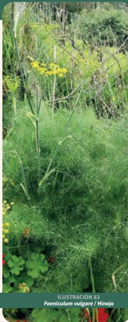
ILUSTRACIÓN 83 Foeniculum vulgare / Hinojo

Uso: diabetes, hígado, riñón y dolores reumáticos (Badgujar et al. , 2014; Rahimi y Ardekani, 2013).