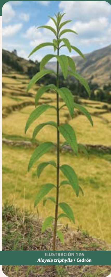
ILUSTRACIÓN 126 Aloysia triphylla / Cedrón

Uso: dolor de barriga por frío o indigestión.