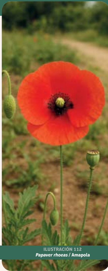
ILUSTRACIÓN 112 Papaver rhoeas / Amapola

Uso: morfina, calmante, sudorífica, sedante, analgésica.