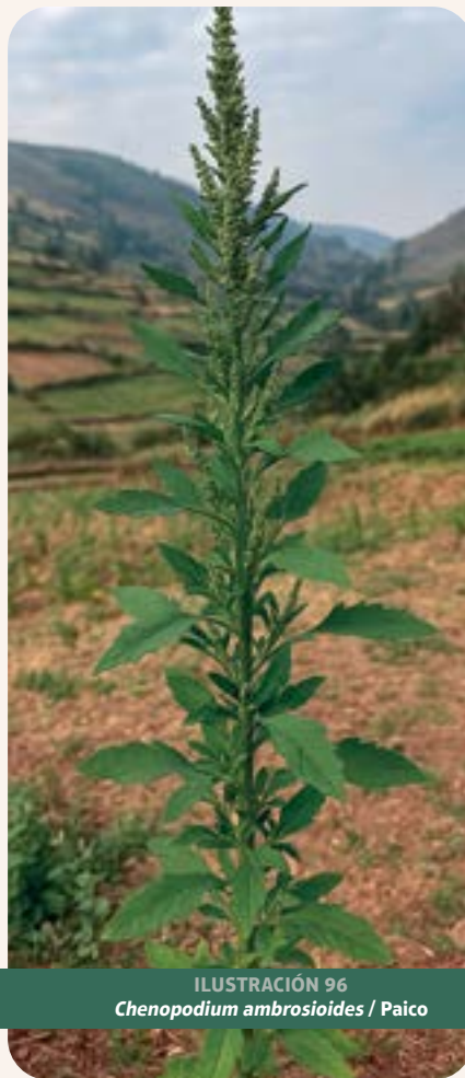
ILUSTRACIÓN 96 Chenopodium ambrosioides / Paico

Uso: resfriados, mal aire, bichos, dolor de cabeza y pasados de frío. Tradicionalmente, se emplea en infusiones o decocciones para tratar trastornos digestivos (cólicos, parásitos intestinales), fiebre, inflamaciones y heridas cutáneas. Estudios etnofarmacológicos modernos han confirmado sus propiedades antiparasitarias, antiinflamatorias, antioxidantes, antimicrobianas y antiespasmódicas (Kasali et al. , 2021).