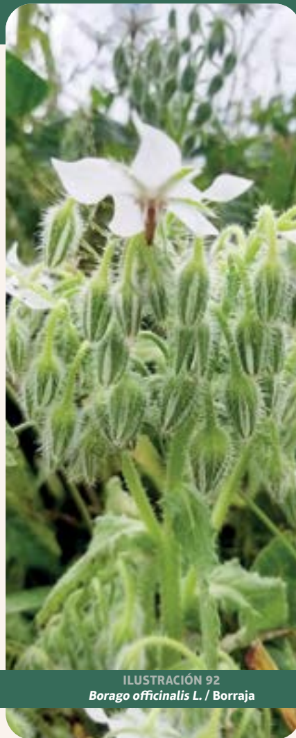
ILUSTRACIÓN 92 Borago officinalis L. / Borraja

Uso: tos y gripe. En la medicina tradicional se emplea como diurético, hepatoprotector, ansiolítico y antiinflamatorio. Ensayos preclínicos e informes clínicos han respaldado su eficacia en el alivio de trastornos inflamatorios, hepáticos y de la piel, así como su uso coadyuvante en afecciones respiratorias (Ramezani et al. , 2020).