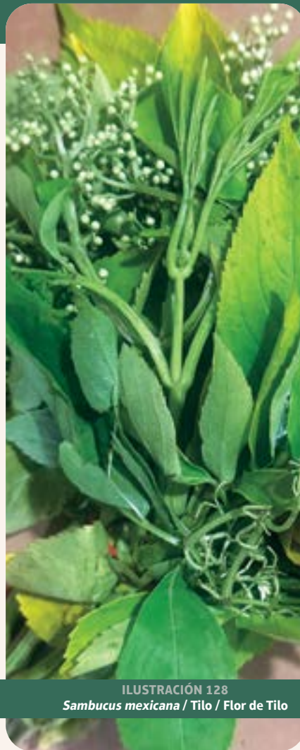
ILUSTRACIÓN 128 Sambucus mexicana / Tilo / Flor de Tilo

Uso: trata afecciones pulmonares y es expectorante. Además, se utiliza para baños postparto.