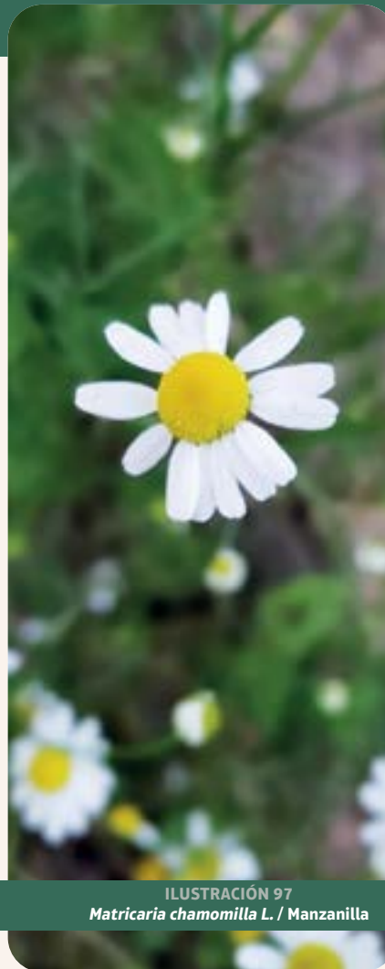
ILUSTRACIÓN 97 Matricaria chamomilla L. / Manzanilla

Uso: según datos de la comunidad : fiebre, cólico de frío, para encaderar y para la infección de ojo. De fuentes bibliográficas consultadas, tradicionalmente se emplea en infusión para tratar afecciones digestivas, inflamaciones de la piel y espasmos musculares, y como calmante del sistema nervioso. Ensayos en vivo en ratones y ratas demostraron actividad analgésica (hot-plate test) y soporífica, con prolongaciones de hasta 117 % en la duración del sueño al administrar extractos secos estándar.