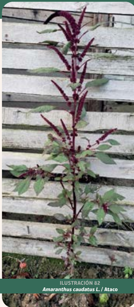
ILUSTRACIÓN 82 Amaranthus caudatus L. / Ataco

Uso: pena, cólera, nervios, cólico, atado de purgas (Jimoh et al. , 2019; Hu et al. , 2021).