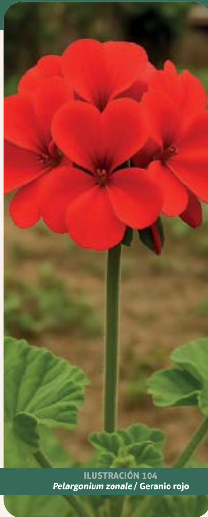
ILUSTRACIÓN 104 Pelargonium zonale / Geranio rojo

Uso: efectos antiinflamatorios y antisépticos. Su extracto ha demostrado actividad analgésica significativa.