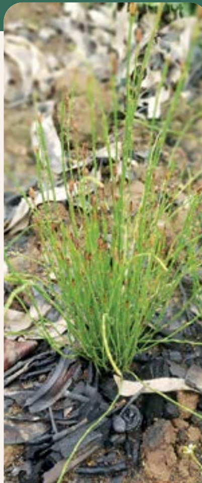
ILUSTRACIÓN 99 Equisetum arvense L. / Cola de caballo

Uso: según información proporcionada por la comunidad, se utiliza para cura el hígado y riñones. De la bibliografía consultada, tradicionalmente E. arvense se utiliza como diurético para el tratamiento de afecciones genitourinarias (litiasis, cistitis), como hemostático en hemorragias leves y en cataplasmas para favorecer la cicatrización de heridas. Estudios preclínicos y ensayos clínicos han confirmado su efecto diurético en modelos animales y humanos, así como actividad antiinflamatoria y cicatrizante (Boeing et al. , 2021).