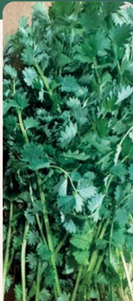
ILUSTRACIÓN 117 Poterium sanguisorba / Pimpinela

Uso: hemostática, astringente, además trata el estrés, el corazón y los nervios. Es utilizada para tratar diarreas, hemorragias y como tónico digestivo (Karkanis et al. , 2014).