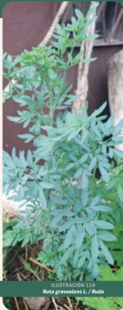
ILUSTRACIÓN 119 Ruta graveolens L. / Ruda

Uso: mal de calle, cólicos, limpias y purgas.