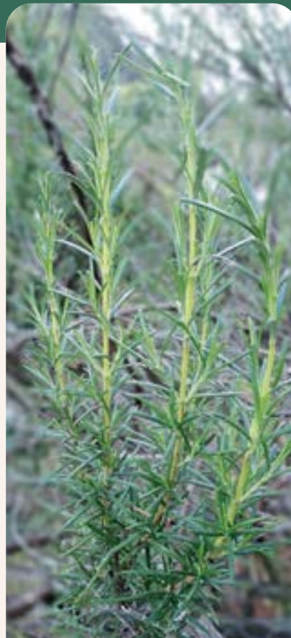
ILUSTRACIÓN 121 Salvia rosmarinus Spenn (sinónimo: Rosmarinus officinalis L.) / Romero

Uso: trata cólicos menstruales, caída de cabello, mal aire y espanto.