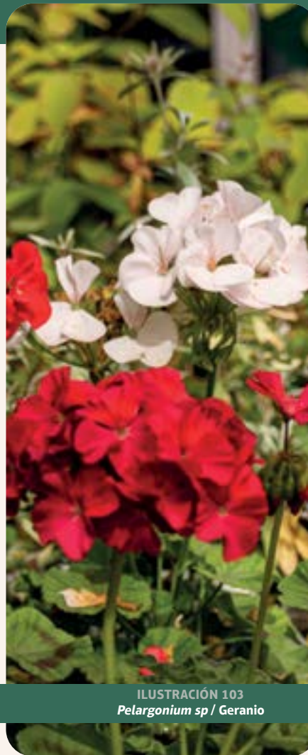
ILUSTRACIÓN 103 Pelargonium sp / Geranio

Uso: diabetes, cicatriza quemaduras y lastimaduras, trata además gastritis y afecciones intestinales.