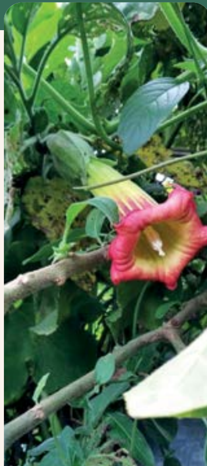
ILUSTRACIÓN 122 Brugmansia sanguinea / Guandug

Uso: tumores, golpes, mordedura de perro, mal aire, sustos y dolores de cabeza.