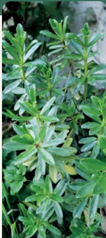
ILUSTRACIÓN 114 Peperomia dolabriformis Kunth / Pata Congona