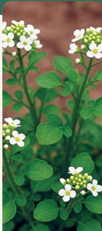
ILUSTRACIÓN 93 Nasturtium officinale / Berro Blanco

Uso: hígado e inflamación intestinal (Chaudhary et al. , 2023).