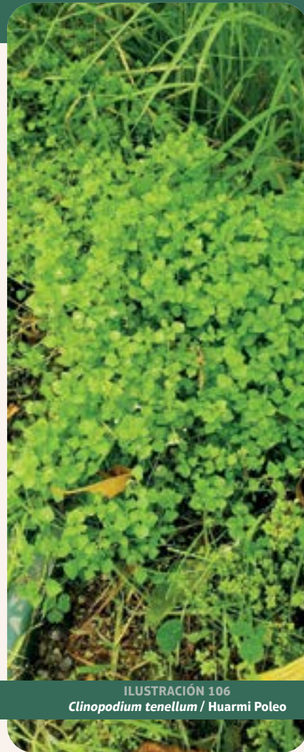
ILUSTRACIÓN 106 Clinopodium tenellum / Huarmi Poleo

Uso: resfrío, tos y mal aire. Es utilizada en medicina tradicional como infusión para problemas digestivos y respiratorios.