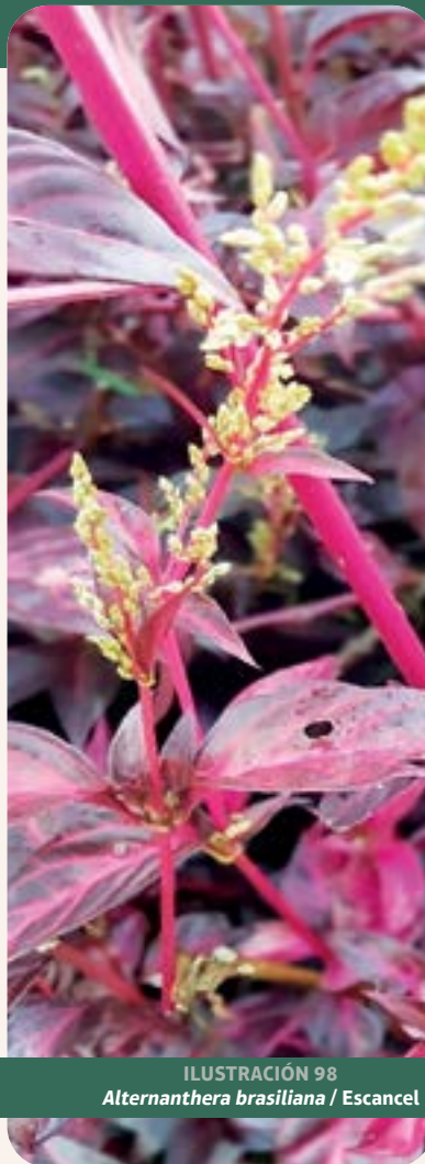
ILUSTRACIÓN 98 Alternanthera brasiliana / Escancel

Uso: según información proporcionada por la comunidad, se usa para fiebre e inflamación del hígado. En la medicina popular brasileña se usa como “penicilina natural” frente a infecciones cutáneas y respiratorias. Se ha demostrado actividad antimicrobiana frente a bacterias grampositivas y gramnegativas, así como efecto antiinflamatorio por inhibición de la desnaturalización proteica (Mandal et al. , 2023).