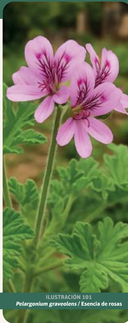
ILUSTRACIÓN 101 Pelargonium graveolens / Esencia de rosas

Uso: según información proporcionada por la comunidad, se utiliza para colesterol, estómago, riñón, nervios y cólicos. Los ensayos in vitro mostraron que el aceite esencial de P. graveolens presenta alta actividad antioxidante (9.16 mM de Trolox) y eficacia antimicrobiana frente a cepas bacterianas y fúngicas (Boukhris et al. , 2013).