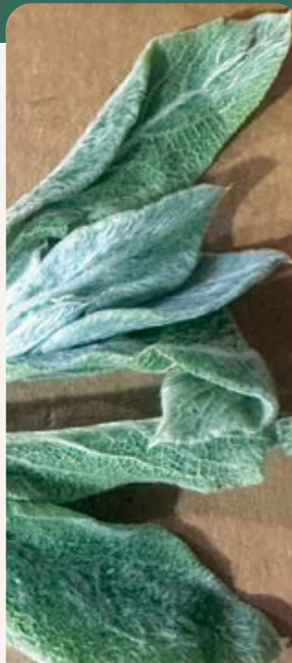
ILUSTRACIÓN 107 Stachys Byzantina / Oreja de burro

Uso: para aliviar la tos y otros problemas de las vías respiratorias, también se utiliza para curar el dolor de huesos. Presenta actividad antimicrobiana y cicatrizante. Se emplea en heridas y afecciones dérmicas.