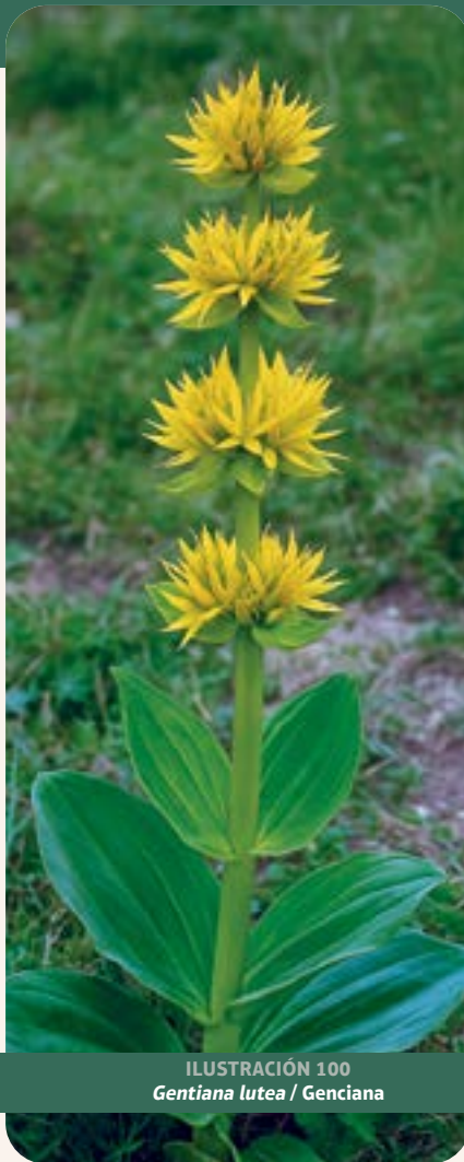
ILUSTRACIÓN 100 Gentiana lutea / Genciana

Uso: según información proporcionada por la comunidad, se usa como hepatoprotectora, digestiva, febrífuga, purificadora de la sangre, antidiabética y para combatir el paludismo. Tradicionalmente, G. lutea se emplea como tónico digestivo y estimulante del apetito. Estudios en humanos e in vivo han demostrado su eficacia para mejorar la dispepsia, estimular la secreción gástrica y modular biomarcadores de estrés oxidativo (Ponticelli et al. , 2023).