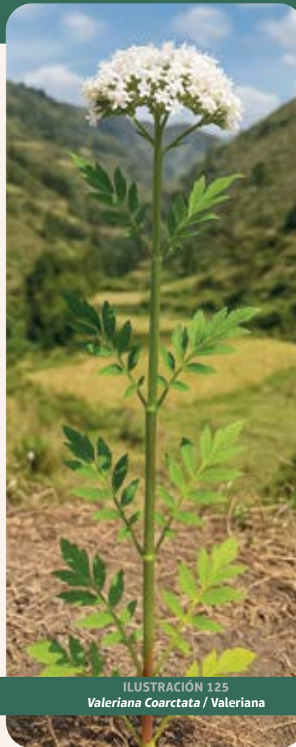
ILUSTRACIÓN 125 Valeriana Coarctata / Valeriana