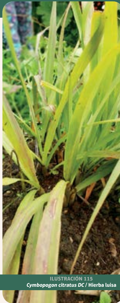
ILUSTRACIÓN 115 Cymbopogon citratus DC / Hierba luisa

Uso: activador de la digestión, dolor de estómago y dolor de cabeza (Shah et al. , 2011).