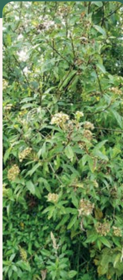
ILUSTRACIÓN 85 Baccharis latifolia / Chilca blanca o negra

Uso: lisiadura, dolor de muela y cabeza, limpiezas de mal aire.