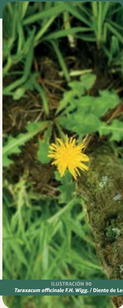
ILUSTRACIÓN 90 Taraxacum officinale F.H. Wigg. / Diente de León

Uso: hígado, riñones, colesterol y diabetes. Tradicionalmente, T. officinale se emplea para estimular la diuresis, favorecer la función hepática y aliviar trastornos digestivos. Ensayos in vitro e in vivo han confirmado sus propiedades diuréticas, antiinflamatorias, antioxidantes y hepatoprotectoras, así como efectos antidiabéticos y antitumorales en modelos celulares (Schütz et al. , 2006; Grauso et al. , 2019).