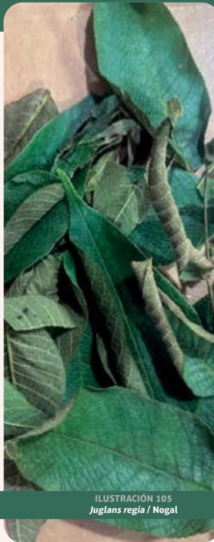
ILUSTRACIÓN 105 Juglans regia / Nogal

Uso: calma la tos y se usa para realizar baños después del parto.