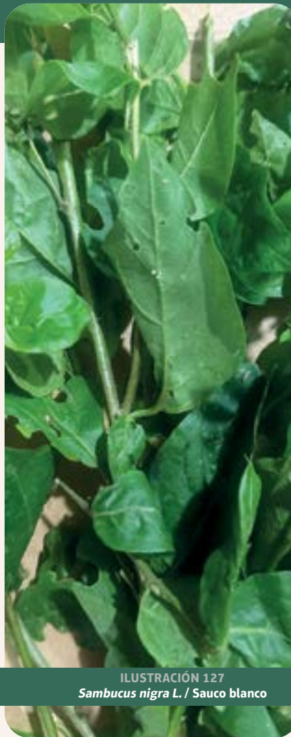
ILUSTRACIÓN 127 Sambucus nigra L. / Sauco blanco

Uso: antimicrobiana, antioxidante, anticancerígena, antiinflamatoria y antiviral. Tradicionalmente utilizada para tratar resfriados, gripe y como inmunoestimulante (USDA NRCS, 2002).