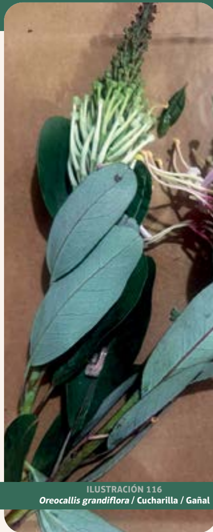
ILUSTRACIÓN 116 Oreocallis grandiflora / Cucharilla / Gañal

Uso: riñones e hígado. Tradicionalmente es utilizada para tratar enfermedades hepáticas y como diurético (Vinueza et al. , 2018).