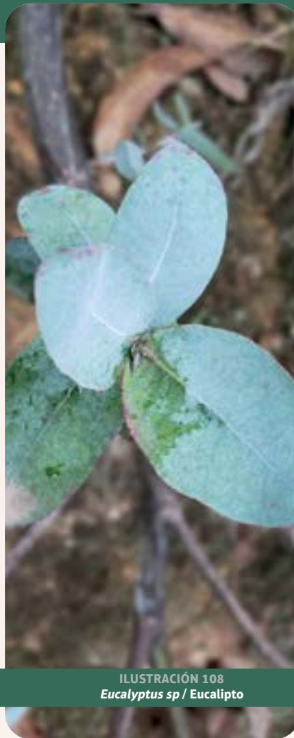
ILUSTRACIÓN 108 Eucalyptus sp / Eucalipto

Uso: según información proporcionada por la comunidad, se usa para resfriados, bronquitis y tos. Es utilizado en infusiones, inhalaciones y ungüentos para problemas respiratorios (Surbhi et al. , 2021).