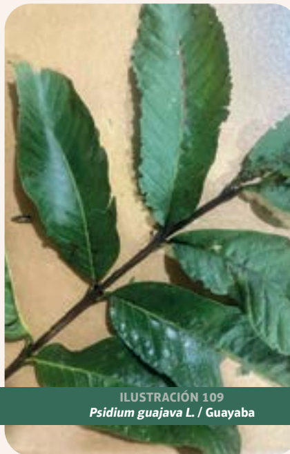
ILUSTRACIÓN 109 Psidium guajava L. / Guayaba