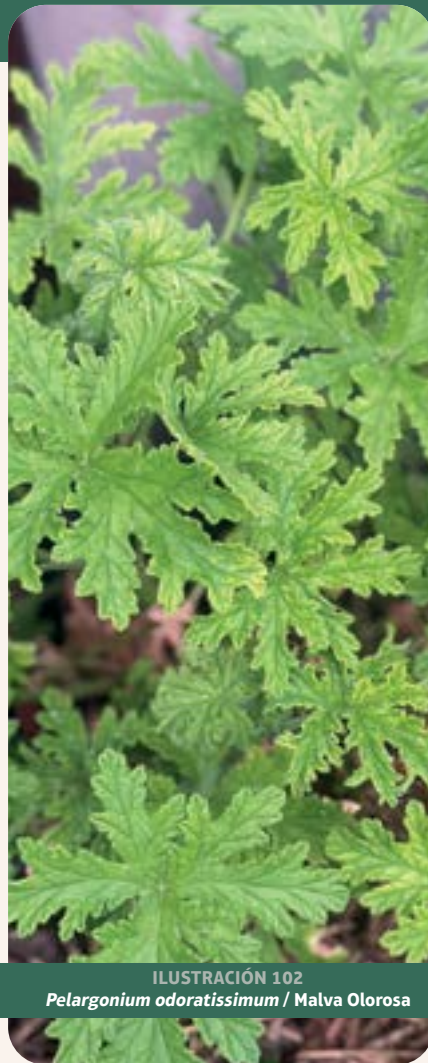
ILUSTRACIÓN 102 Pelargonium odoratissimum / Malva Olorosa

Uso: trata nervios, dolor de estómago, cólicos, gangrena, limpiar intestinos, inflamación, golpes. Funciona además como equilibrante emocional, antidepresivo, energizante, antiinflamatorio, antiséptico, astringente, cicatrizante, desodorante, fungicida, coagulante y diurético (Andrade et al. , 2011; Lis-Balchin y Roth, 2000).