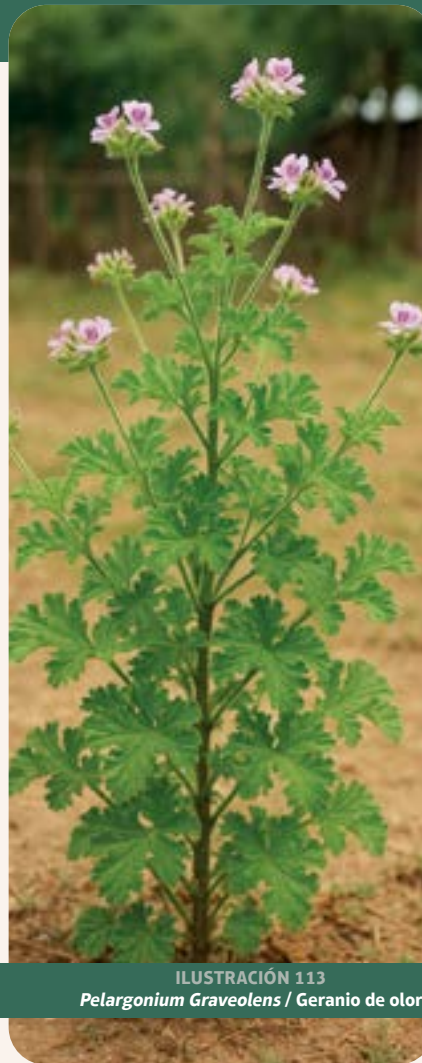
ILUSTRACIÓN 113 Pelargonium Graveolens / Geranio de olor

Uso: bronquitis, tos, sufrimiento, nervios, susto, golpes, riñones y rabia.