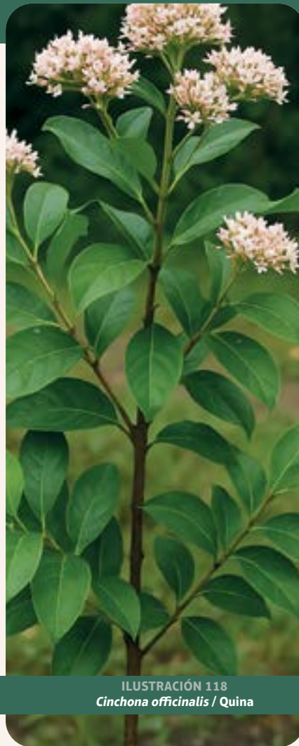
ILUSTRACIÓN 118 Cinchona officinalis / Quina

Uso: para el tratamiento de la malaria: su principio activo más importante, la quinina, fue el primer medicamento eficaz contra la malaria, aislado por primera vez en el siglo XVII. Tradicionalmente se usaba también como febrífugo y analgésico; como tónico amargo para estimular el apetito y mejorar la digestión; y como antiséptico, antipirético y para tratar infecciones respiratorias.