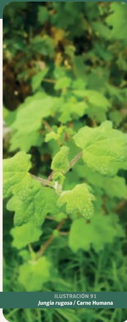
ILUSTRACIÓN 91 Jungia rugosa / Carne Humana

Uso: sanar heridas, regular el azúcar en la sangre, resfríos y ayudar en las vías urinarias (Wilches et al. , 2015).