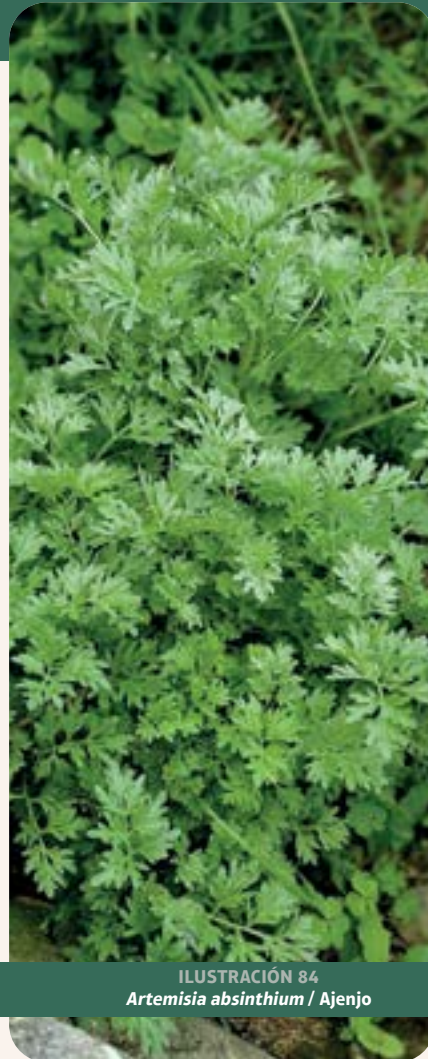
ILUSTRACIÓN 84 Artemisia absinthium / Ajenjo

Autores: José David Orellana y John Soliz