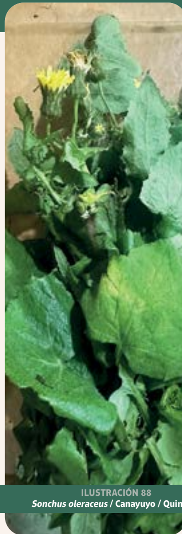
ILUSTRACIÓN 88 Sonchus oleraceus / Canayuyo / Quinquín

Uso: fiebre, recaída, laxante, diurético y depurativo (Sánchez-Aguirre et al. , 2024).