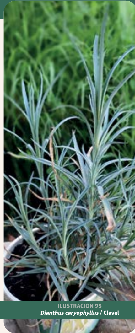
ILUSTRACIÓN 95 Dianthus caryophyllus / Clavel

Uso: nervios, colerín, pena y mal de calle. Estudios experimentales in vitro e in vivo han confirmado que extractos de D. caryophyllus poseen potentes actividades antiinflamatoria, anticancerígena, antibacteriana, antifúngica, antiviral, insecticida, repelente, antioxidante y renoprotectora (Survase et al. , 2024).