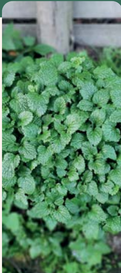
ILUSTRACIÓN 124 Melissa officinalis L. / Toronjil

Uso: el toronjil es empleado como planta medicinal en infusiones para aliviar el insomnio, el estrés, la ansiedad y los trastornos digestivos leves. También se utiliza como aromatizante natural en bebidas y como calmante en cuadros de agitación nerviosa o melancolía.