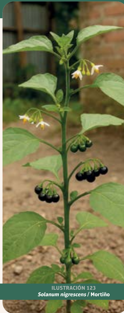
ILUSTRACIÓN 123 Solanum nigrescens / Mortiño

Uso: trata gripe, tos y enfermedades respiratorias.