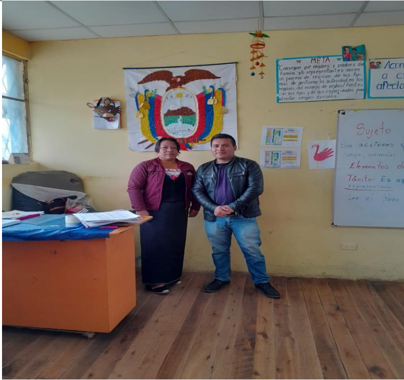
ANEXO 3: ENTORNO DEL AULA CLASE.