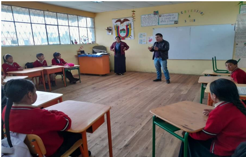
ANEXO 4: ENTORNO ACADEMICO.