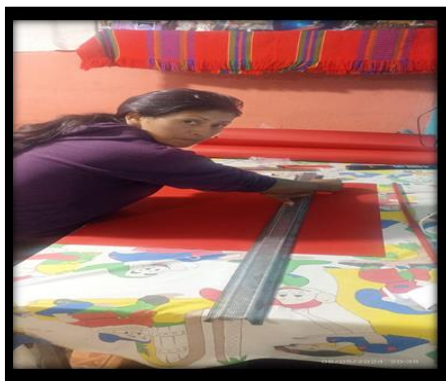
Foto del estudiante con el recurso didáctico terminado: proceso

Fotos del proceso de elaboración del recurso: en proceso