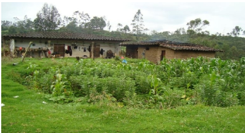
Foto 9/ Ubicación de los cultivos

Los productos agrícolas que tienen una gran perspectiva productiva y de comercialización en las comunidades son las hortalizas, las frutas y las flores, que en ciertas épocas del año venden, parte de sus pequeños excedentes.