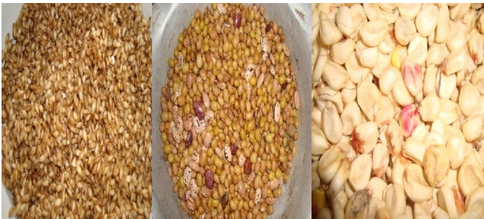
Foto 4/ Productos para la comercialización

Hasta los años de 1940, los Saraguros mantenían una economía de subsistencia, a través del sistema de trueque con poblaciones de la provincia de Loja, Zamora Chinchipe y el Oro, basándose en el intercambio de Queso, quesillo y granos, estos eran intercambiados con sal, panela, arroz; actividad que lo realizaban con largas caminatas con la ayuda de acémilas.