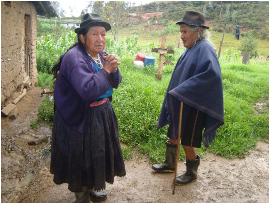
Familia Indígena de la comunidad de Gurudel/Foto 1/Autora