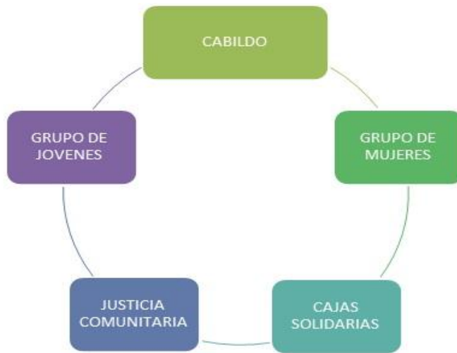
Figura 1/ Actores Comunitarios/ Autora