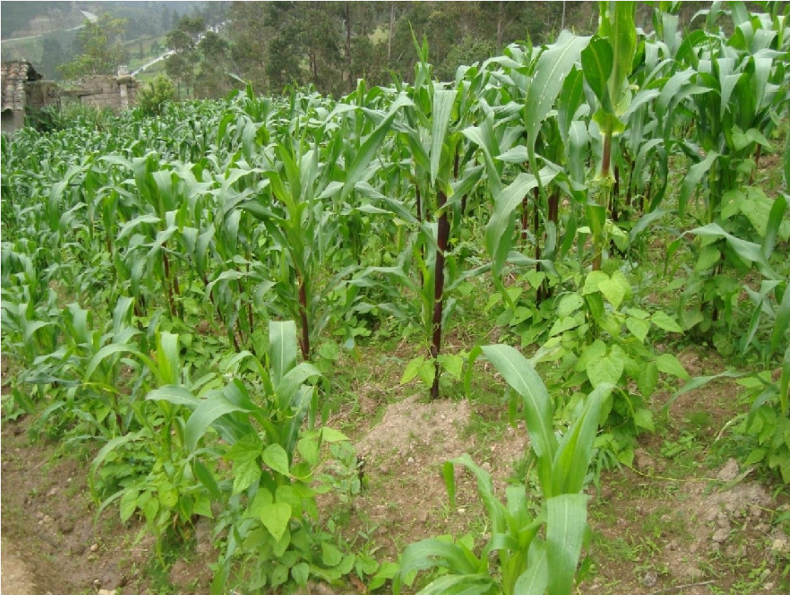
Foto7/Cultivo de Maíz asociado/ Autora.

De igual forma cultivan: oca, melloco, achogcha, zambo y zapallo productos destinados en gran parte al autoconsumo. El ajo, cebolla y cereales se producen en atención al mercado local. En algunas comunidades del Cantón a diferencia de las comunidades de Gurudel y Zhadampamba, mantienen algunos invernaderos de cultivos de tomate riñón, babaco destinados al mercado local.