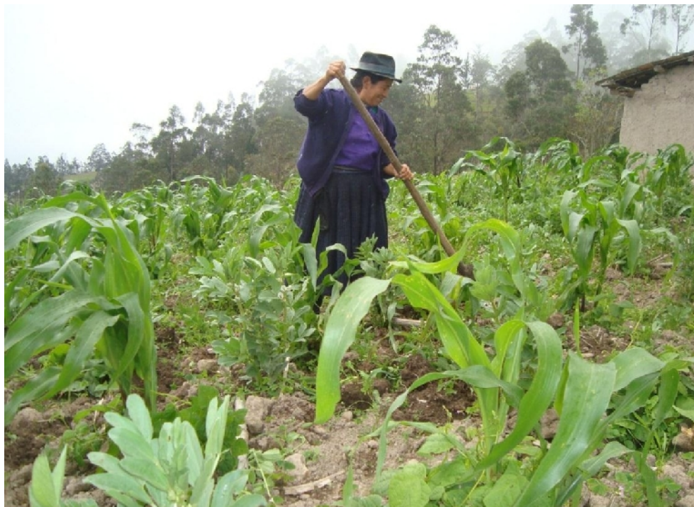
Foto 6/ Lampeando el maíz/ Autora

En la mayoría de las comunidades, la agricultura es el soporte familiar, siendo una actividad que realizan con prácticas artesanales, la preparación de la tierra realizan a través del arado para esto utilizan las siguientes herramientas: arado, reja, yugo garrucha, yunta, abono orgánico. Asimismo practican un sistema de rotación para la siembra de los productos, como cultivos asociados de diferentes productos: maíz, frejol, haba, zambo, achogcha que rotan con arveja, papas, trigo y cebada.