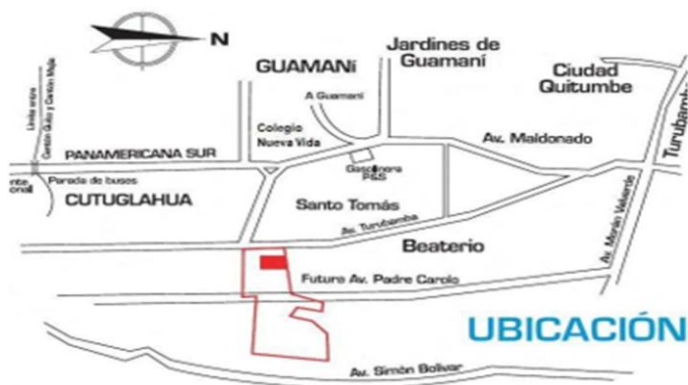
Figura 3: Mapa de ubicación de Guamaní