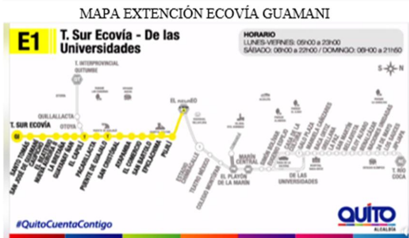
Figura 2: Mapa de extensión de ecovía de Guamaní