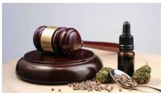
Figura 1. Mazo de jueces sobre marihuana y cáñamo. Fuente: [2]

que la ilegalización no está funcionando y solo está conduciendo a la creciente violencia y al crimen organizado. Por otro lado, en algunos países como Portugal y Holanda se han legalizado y regulado las drogas, lo que ha permitido una reducción significativa en los índices de consumo y de delitos relacionados con drogas. También sostienen que la legalización permitiría que el Estado tenga el control y la supervisión en la producción y distribución de las drogas, lo que podría mejorar la calidad de las sustancias, la prevención de las adicciones y la reducción del riesgo de sobredosis [1].