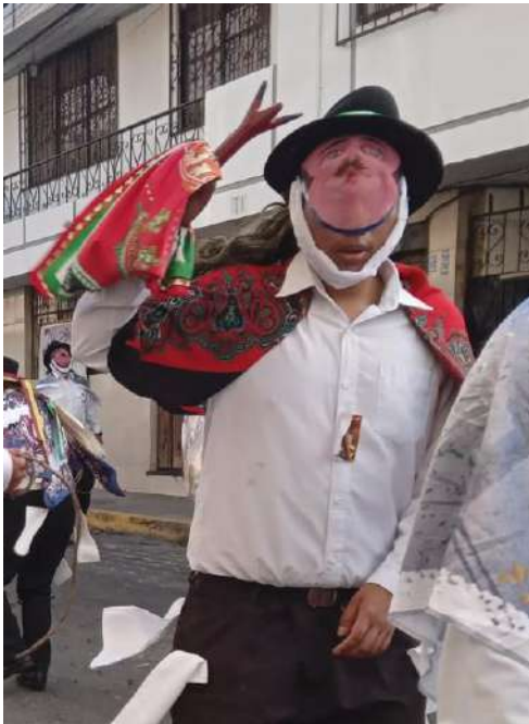
Figura del toro