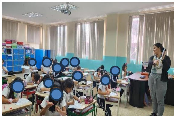
Figura 4 y 5.