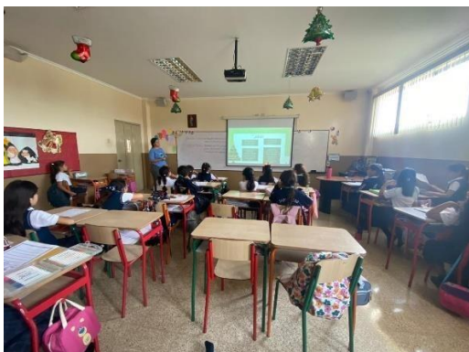
Figura 2 y 3.