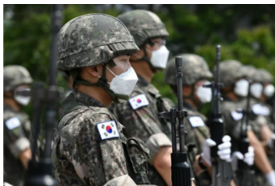
Figura 4. Fuerza armada en Corea del Norte

deben servir al menos diez años en el ejército, durante los cuales reciben algún tiempo de licencia. "A los norcoreanos se les enseña a odiar al mundo exterior, especialmente a Estados Unidos y Corea del Sur, como sus principales enemigos" (PSCORE, 2023). En cuanto a Corea del Sur, es bien sabido que el servicio militar es obligatorio para los hombres y debe completarse antes de los 30 años, tiene una duración de aproximadamente dos años, y si no completan su servicio, pueden ser enviados a prisión [5].