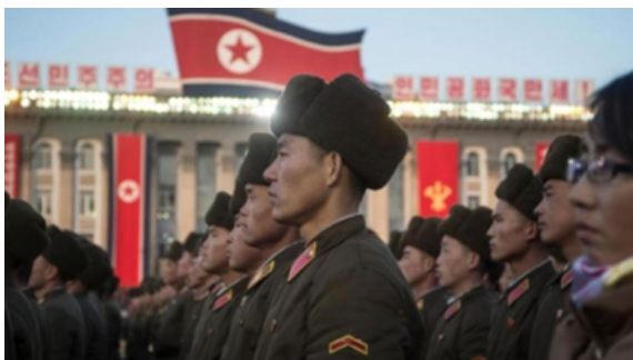
Figura 3. Militares de Corea del Norte

Uno de los mayores problemas de Corea del Norte es el hambre y la desnutrición constantes. Los norcoreanos pueden comprar alimentos de dos maneras: a través de pequeños mercados legales o negros, o mediante el racionamiento del gobierno. Corea del Norte tiene una cantidad espantosa de prisioneros ilegales y, aunque Corea del Norte no lo admite, el país tiene muchos campos de concentración. Huir del país es un tema muy recurrente, y pese al enorme riesgo que esto supone cada año más de mil norcoreanos intentan escapar por sus derechos, el hambre, el agotamiento y el temor por sus vidas y la de sus seres queridos. La mayoría de los desertores esperaron hasta el invierno para cruzar el río Yalu en la frontera con China, cuando el río estaba frío y la corriente débil [5].