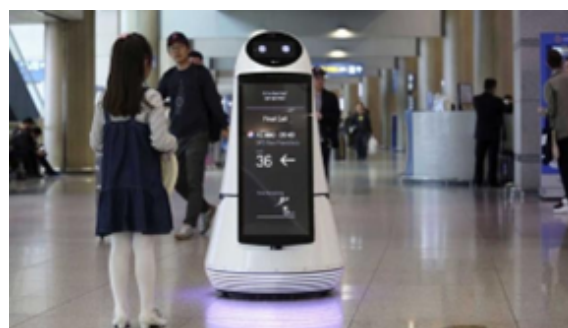
Figura 2. Tecnología en Corea del Sur

El siguiente punto es el avance de la tecnología, Corea del Sur es un gigante innovador de la industria tecnológica. Desde este país, importantes marcas de equipos electrónicos idealizan, diseñan, patentizan y materializan cada año productos de alta tecnología sin precedentes, productos que son distribuidos por todo el mundo. Este país industrial es el hogar de marcas famosas como Samsung, LG Group, Kia, Pantech, Curitel, Fila, Hyundai Motor Company, etc. El PIB per cápita de Corea del Sur en 2022 fue de 30.762 euros o 32.182 dólares, lo que lo sitúa en el puesto 36 de los 196 países del ranking de PIB per cápita [3, 4].