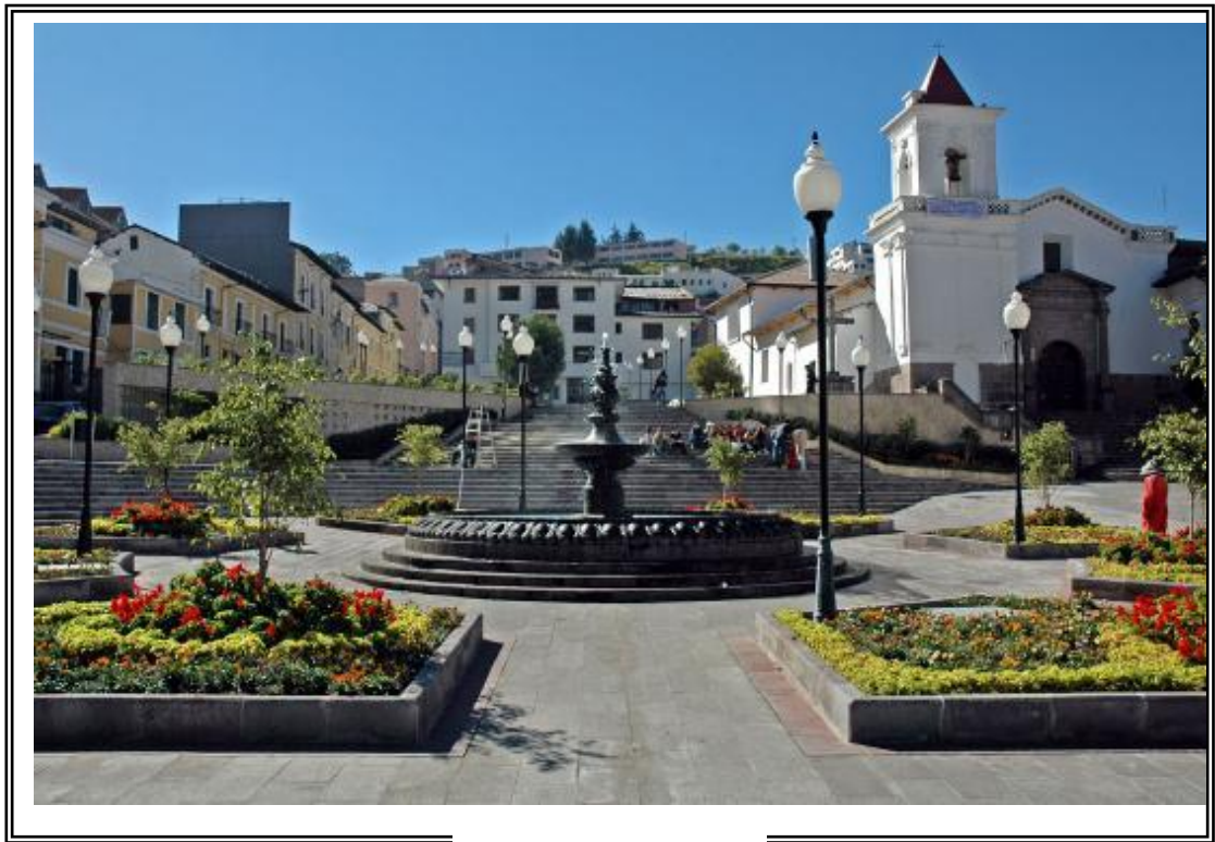
San Blas Moderno

La Iglesia de San Blas es, junto con San Sebastián, la iglesia parroquial más vieja de Quito. Fue construida en una ladera que lleva al Itchimbía y próximo a los pastizales reales de Ñaquito (actualmente Parque de La Alameda) y aunque fue reconstruida, su diseño original fue una cruz, pero con paredes piramidales (1620). La fachada principal es hecha de muro y adobe, tiene un campanario de piedra y la puerta posee un par de columnas onduladas corintias que sostienen el frontón triangular. El interior, fabuloso a pesar de su modestia, tiene un pequeño retablo en la pared posterior y un púlpito con la imagen de San Blas.