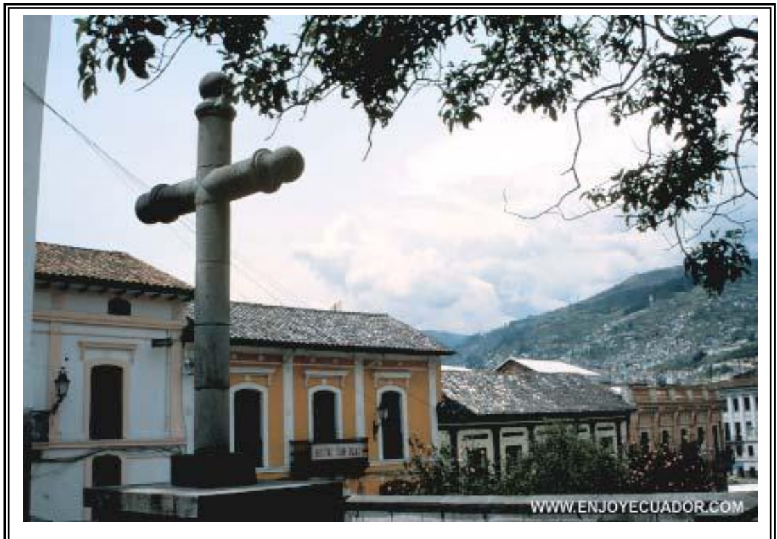
Cruz Iglesia de San Blas