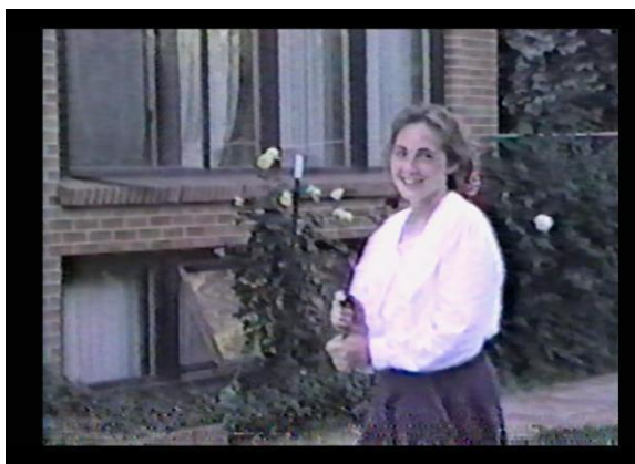
Ilustración 1 Primera aparición de Rebecca Wall. (Dretzin, Rachel; McNally Grace, 2022)

El personaje presenta un modelo de mujer característico de los años 30, se recalca su forma de vestir con vestidos ceñidos al cuerpo para evitar resaltar sus curvas. Las características que guarda el personaje por su forma de vestir, gestos y acciones, se puede identificar al irónico personaje que estereotipa la clásica idea de la ‘niña bien’, la niña de casa, además se empieza a distinguir de poco en poco el carácter dócil que representa al personaje.