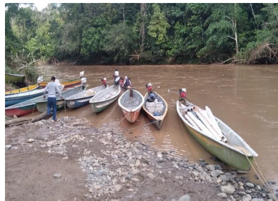
Puerto fluvial Zazampi –Rio Bobonza -Canelos