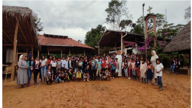
Convivencia vocacional 2023- Sarayaku