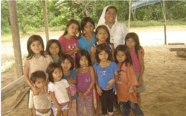
Acompañamiento de niños por las hermanas Corde Jesu de las comunidades de la zona 5.