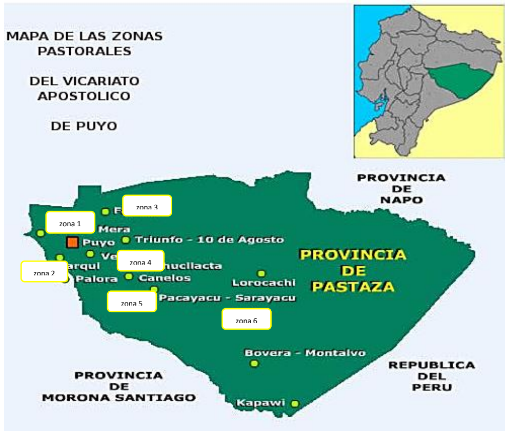
Figura 1. Mapa del Vicariato Apostólico de Puyo

Nota: La figura muestra las zonas 6 pastorales del Vicariato Apostólico de Puyo.