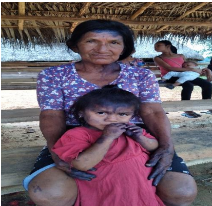
Comuneros Kichwas de Pacayacu