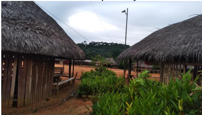
Sarayaku de Boveras-Montalvo Vivienda tipo choza – Sarayaku