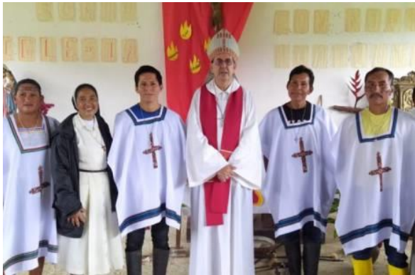
Ministros Kichwas de la palabra y la eucaristía