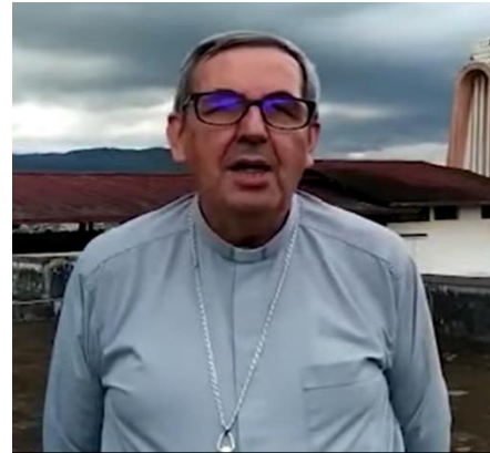
Monseñor Rafael Cob - Obispo del Vicariato apostólico de Puyo