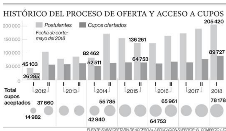
Figura 2. Comparación de postulantes y cupos ofertados en las universidades del Ecuador Fuente: [3]

Podemos observar que existe un gran problema no solo a nivel educativo, también a nivel organizativo y de gestión de las autoridades, donde no existe la oportunidad de acceso a la educación superior, donde los postulantes superan con gran amplitud el número de cupos ofertados.