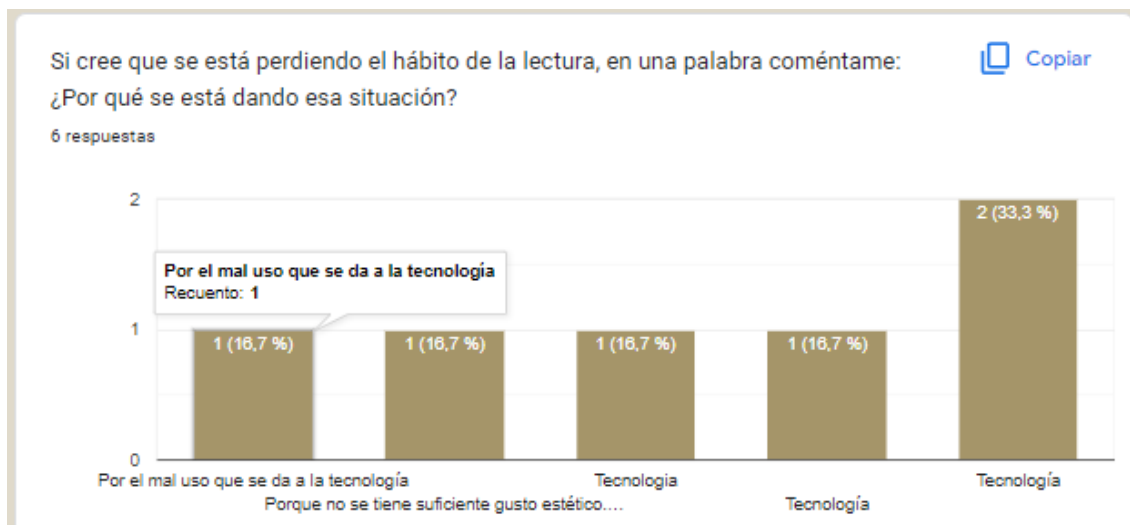
Figura 1. Formulario aplicado