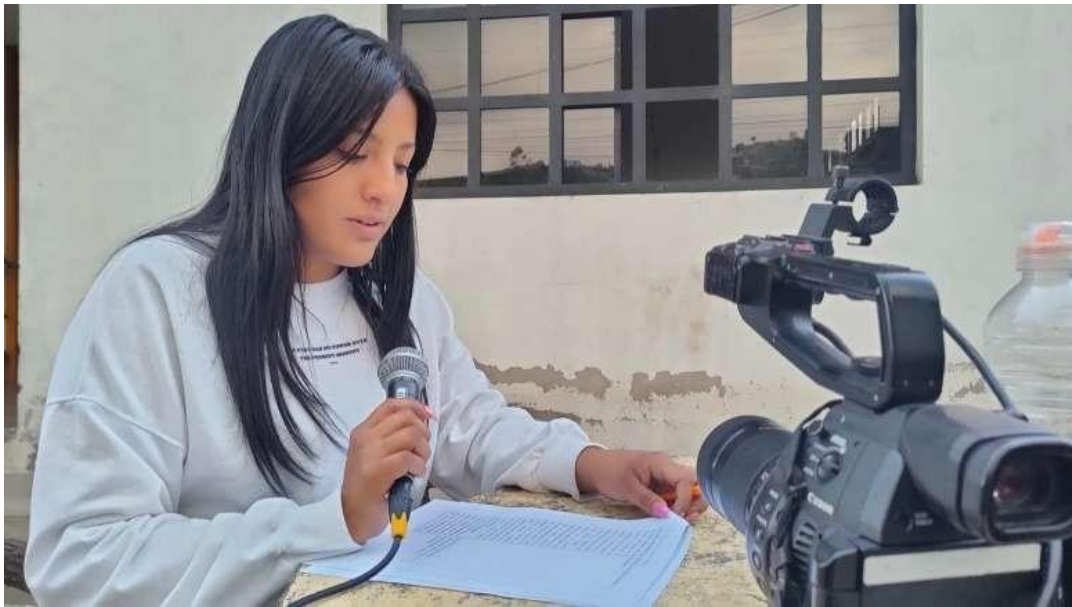
Ilustración 2 Fotografía realizada en la grabación de la cuña