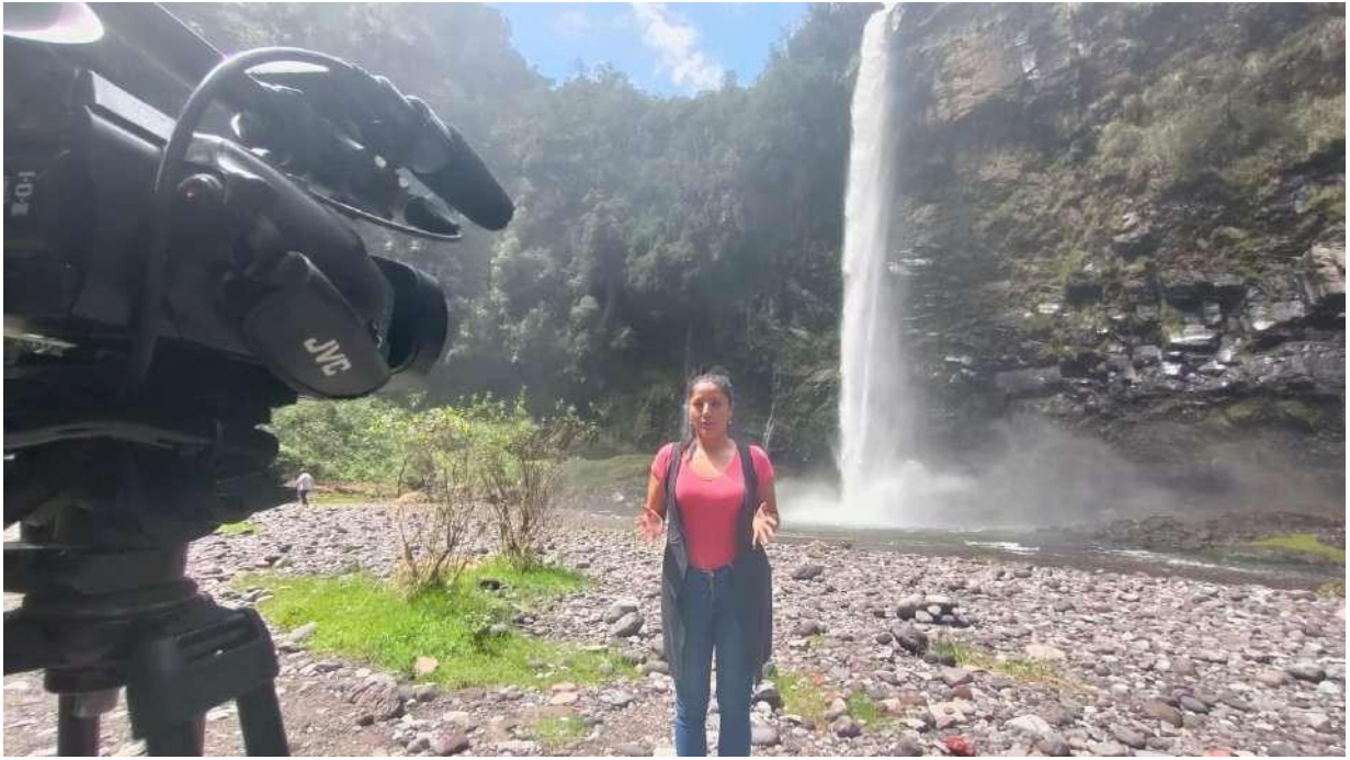
Ilustración 3 Fotografía realizada en la Cascada Condor Machay