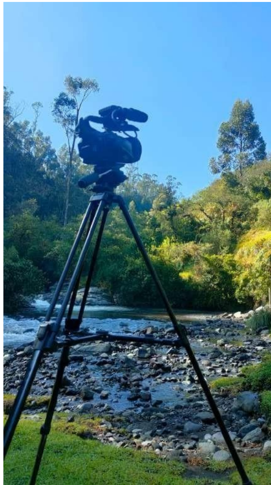
Ilustración 4 Fotografía realizada en la cascada Vilatuña