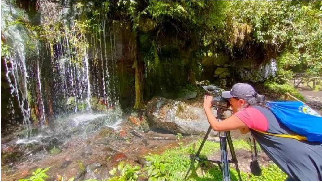
Ilustración 1 Fotografía realizada en la Cascada Cóndor Machay