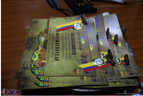
Figura 1. Diplomas nacionales para el arte local y nacional

puedo hacerlo en la agrupación particular: JATARY SUNCHY, que también me ha permitido conocer espacios importantes en la ciudad como en el teatro Pumapungo y el Festival de Balzay.