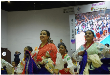
Figura 2. Grupo de danza folclórico: Colibrí de Fuego / Noche Cultural de Congreso Nacional de la Educación / Confede