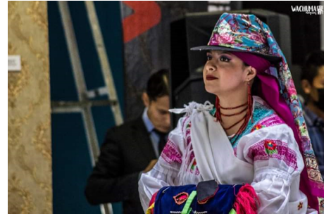
Figura 4. Presentación en Festival. Teatro Pumapungo