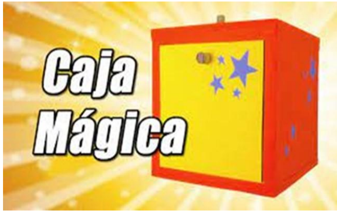
Ilustración 3. Jugando a encestar en las vocales