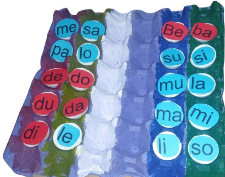
Ilustración 4. La cubeta de letras – jugando a formar palabras