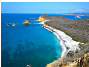
Figura 1. Parque Nacional Machalilla

En este documento queremos mostrar las maravillas que guarda el Parque Nacional Machalilla. Es una de las áreas protegidas más extensas de la Costa ecuatoriana, comprende dos zonas, una terrestre (56 184 ha) y una marina (14 430 mn) [1]. Cuenta con cinco cuencas hidrográficas, las de los ríos Salaite, Cantagallo, Ayampe, Buena Vista y Jipijapa. Dentro de la zona terrestre se encuentran ubicados distintos centros poblados como Puerto López, Puerto Cayo, Machalilla y Salango.