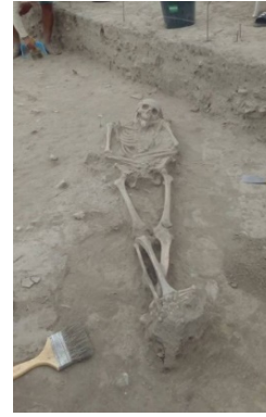
Figura 2. Inhumación de restos

Mediante evidencias arqueológicas se han encontrado zonas que indican el asentamiento de culturas prehispánicas las cuales han ocupado estos territorios hace más de 7000 u 8000 años. La cultura Manteño-Huancavilca (1500 a. C. – 500 d. C.) fue una de las más importantes [2]. Se encontraron troncos de piedra demostrando su poderío e importancia, desarrollaron el arte de navegación de vela, emplearon balsas, convirtiéndose así en grandes mercaderes de su época.