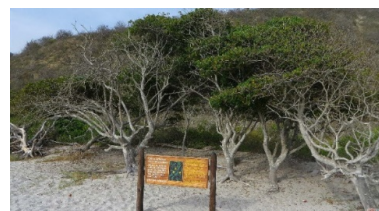
Figura 4. Diversidad de flora en la Reserva Machalilla