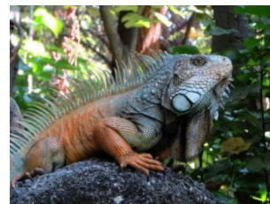
Figura 3. Diversidad de fauna en la Reserva Machalilla Fuente: shorturl.at/fkrxG

Dentro del parque nacional podemos encontrar una gran diversidad de fauna incluyendo especies poco comunes como el jaguar, mono aullador, ocelote, tigrillo, ciervo, venado de cola blanca, murciélagos, variedad de anfibios, etc. Las tortugas marinas que anidan en las playas del parque. Por otro lado, la flora está compuesta por bosques húmedos de garúa, parecidos a los de los bosques nublados andinos, mientras que a la costa se convierte en matorrales secos donde la vegetación se vuelve robusta con cactus candelabro [4].