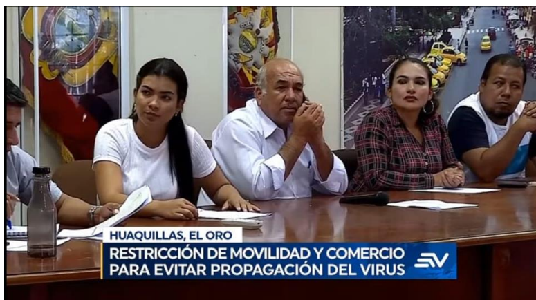
Ilustración 2. Ejemplo de Sencillez