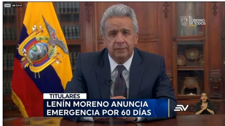
Ilustración 1. Ejemplo de Claridad.