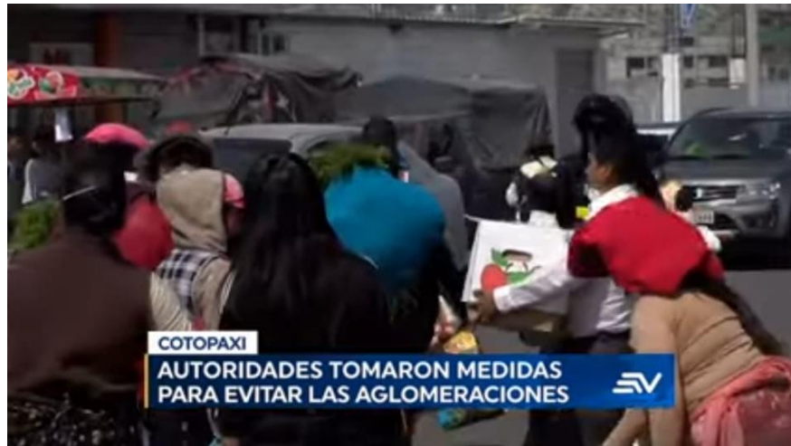
Ilustración 3. Ejemplo de Voz activa