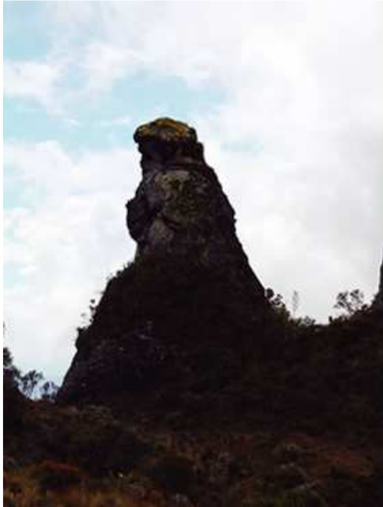
Foto 6. Cónдор de los Andes tallado en Piedra