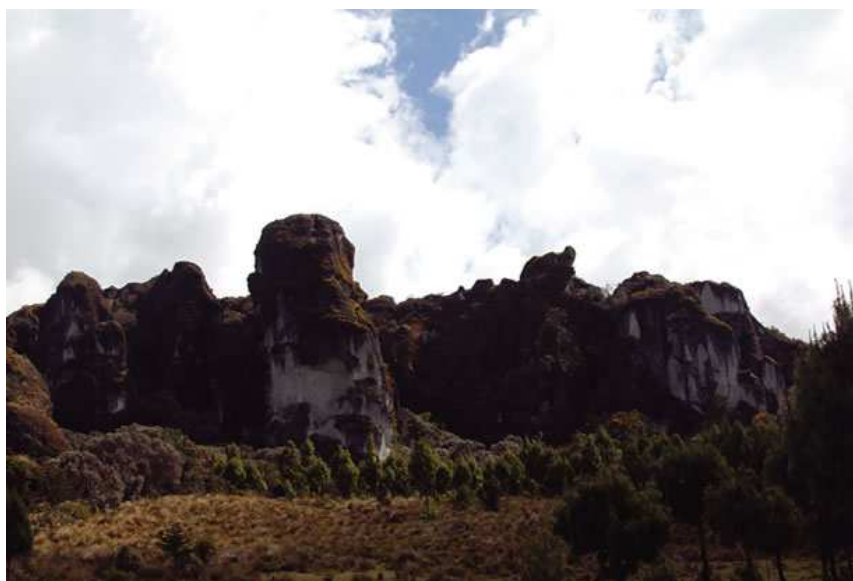
Foto 1. Carachula o Ciudad de Piedra

Para llegar a este lugar existen dos vías de acceso: la primera, por el cantón San Fernando y la segunda, por el cantón Santa Isabel, hasta la parroquia Shaglli. Su camino esta adornado de inmensas arboledas y plantas medicinales. A lo largo del camino se puede distinguir distintas plantas silvestres, animales salvajes y reptiles, haciendo de este lugar su hábitat.