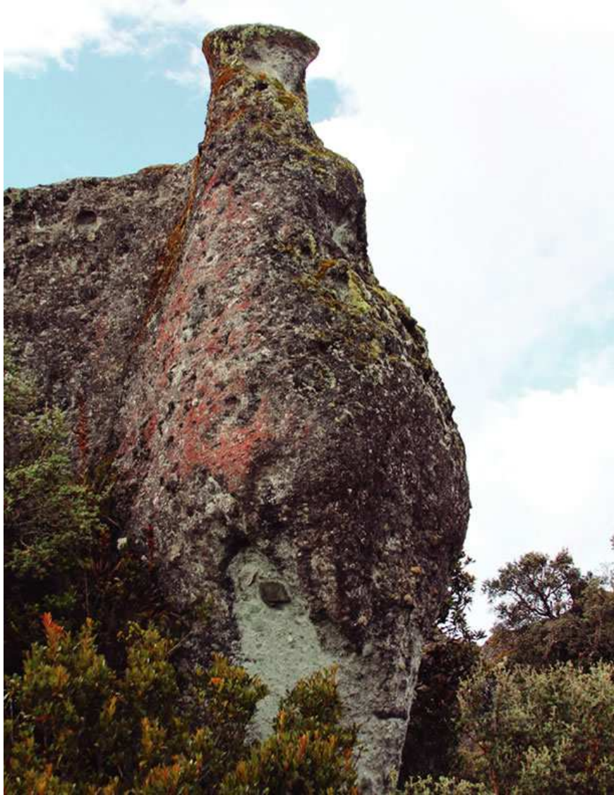
Foto 5. El Jarrón de Piedra tallado el rostro del Dios del Viento