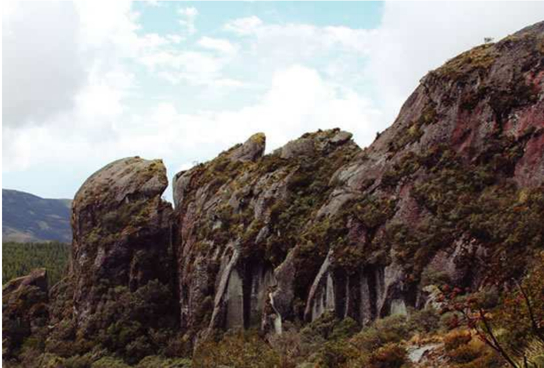
Foto 4. Cavernas en piedra