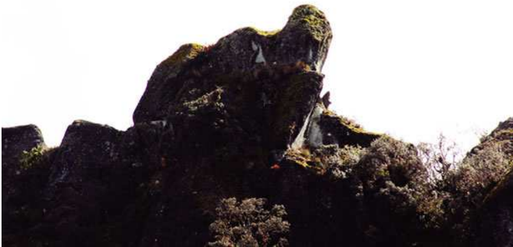
Foto 2. Mastodonte

Una de las figuras que más se destaca a la entrada de Carachula es el imponente mamut que se encuentra tallado en la cima de la roca más alta del lugar.