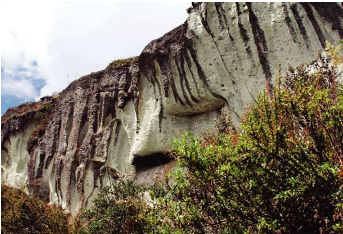
Foto 3. Rostros humanos en piedra

Rostros humanos con diferentes expresiones se encuentran esculpidas en las paredes de piedra de este hermoso lugar arqueológico, revelan los rostros de todos aquellos humanos que fueron sacrificados a los Dioses para un bien mayor.