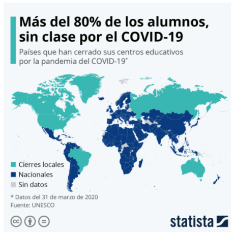
Figura 1. Más del 80% de alumnos sin clase por covid-19 Fuente: UNESCO (2020).

Tras este acontecimiento se generó el cierre de las instituciones y centros educativos y estos en su deber de brindar una educación pertinente y de calidad, optaron por enseñar mediante las plataformas digitales; sin embargo, la falta de preparación y organización de dichos sistemas imposibilita la total comprensión de los temas a abordar durante el año lectivo para los jóvenes y niños [2].