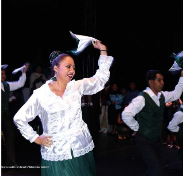
Representación obra de teatro "Todas Somos Cumbayá"

Este producto comunicacional es un aporte tanto para los moradores de la Parroquia de Cumbayá, en el sentido de revitalizar su cultura, así también, para quienes se interesan en el campo de las prácticas culturales e identitarias que forman parte de una determinada sociedad.