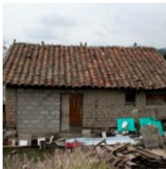
Vivienda de barro adobe en Cumbayá

Las casas de adobe, en Cumbayá por ejemplo, la Ley de Comunas, se implementó como ley, no destruyeron las casas de adobe que tenían más de 70 años, ya que estas son parte de su historia y crecimiento como Comuna.