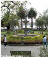
Plaza del Parque en Cumbayá

La Plaza del Parque, se hizo en cuatro al pargan en el, y no conserva su aspecto histórico y a pesar de haberse remodelado, la plaza es la que menos ha sufrido cambios por acciones de sus moradores.