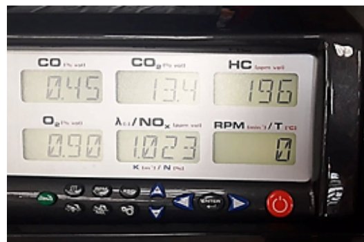
Figura 6. Resultado de las emisiones en la prueba número 6. Elaboración propia

contaminante; por lo tanto, se llegó a la conclusión de que la última prueba realizada en el vehículo cumple con dichas exigencias como se puede observar en la Figura 6 estableciéndose el valor de 1° de adelanto al encendido.