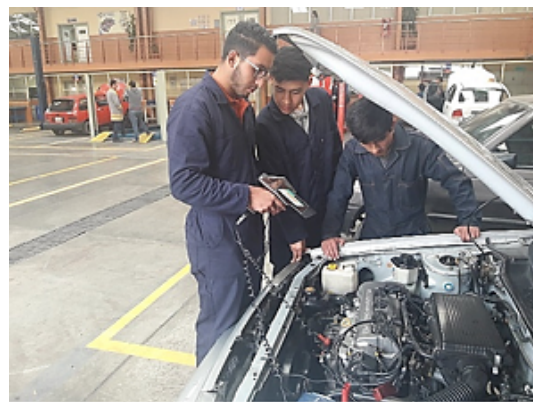
Figura 2. Verificando el punto de encendido del vehículo en estado inicial. Elaboración propia

Como se puede observar en la Tabla 3, las pruebas del 1 al 5 no cumplen con las especificaciones indicadas para pasar la revisión técnica vehicular, esto es debido a que en el momento que se adelanta el punto encendido, se producen hidrocarburos no combustionados, incrementando evidentemente los HC presentes en los gases de escape, por otro lado, el monóxido de carbono tiende a incrementarse, mientras que el oxígeno tiende a disminuir notablemente hasta la cuarta medición. Al adelantar el punto de encendido se empobrece la mezcla que a su vez tiende a incrementar la temperatura del motor, provocando un mayor consumo de combustible.