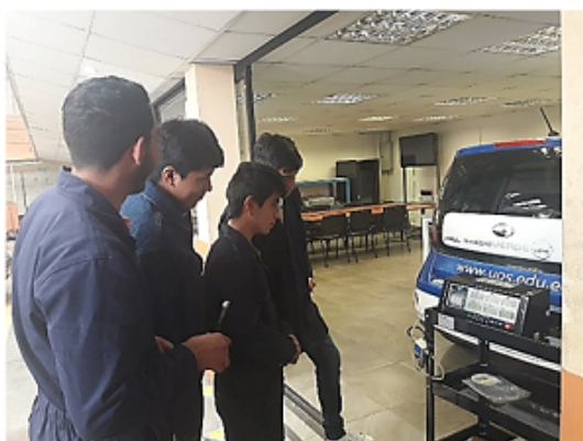
Figura 4. Tomando las muestras de los gases de escape. Elaboración propia