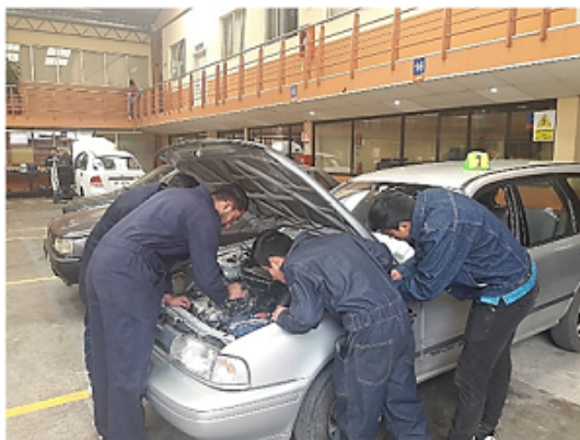
Figura 3. Ajustando el punto de encendido. Elaboración propia