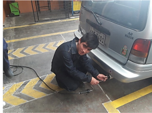
Figura 1. Insertando la sonda de muestreo en el escape del vehículo. Elaboración propia

En Tabla 2, podemos observar que el vehículo no cumple con los requerimientos necesarios para la revisión técnica vehicular. establecidos para la revisión técnica vehicular, según los resultados obtenidos los hidrocarburos medidos en partes por millón (ppm) sobrepasa el valor establecido en la norma INEN 2204.