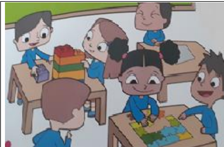
Figura 4. Portada del texto escolar Mis Primeros talentos Elaborado por Maritza Yáñez (2019)

Como en el texto escolar al principio de hoja consta como portada una imagen grande la docente usa una estrategia metodológica la cual el niño pueda distinguirla a través del gráfico haciendo un análisis como: viendo el color, forma, tamaño y posición tomando en cuenta que no sabe leer todavía de todas las imágenes que consta el texto.