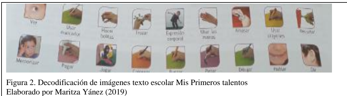
Figura 2. Decodificación de imágenes texto escolar Mis Primeros talentos Elaborado por Maritza Yáñez (2019)

Además en cada lámina del texto escolar aparece una decodificación de imágenes en el cual se representa las diferentes destrezas psicomotrices, cognitivas y sociales las cuales son ver, usar marcador, hacer bolitas, trozar, expresión corporal, usar las manos, amasar, usar crayones, recortar, pegar, jugar, colorear, punzar, pintar, hablar y oír.