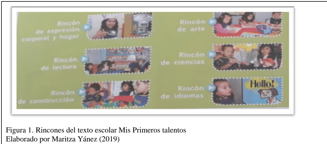
Figura 1. Rincones del texto escolar Mis Primeros talentos Elaborado por Maritza Yáñez (2019)

El texto escolar posee diversas láminas, en la primera foto se encuentra con la lámina que contiene la información del trabajo para lo cual consta de lo siguiente: el nombre de cada niño, fecha de registro, las actividades a desarrollar, los ámbitos, las destrezas que se van a desarrollar y por últimos el informe cualitativo el cual se verá evaluado en el aula y será calificado acuerdo a cada destreza de forma iniciada, en proceso o adquirida.