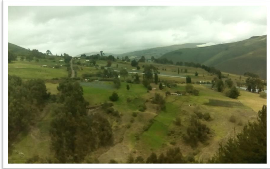
Figura 1. Ubicación de la comunidad Pancún Ichubamba