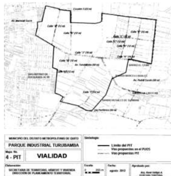
Ilustración 2 Mapa 4 Parque Industrial Turubamba (PIT), agosto 2012 STV

en el año 2012 por el arquitecto Rodrigo Vallejo.