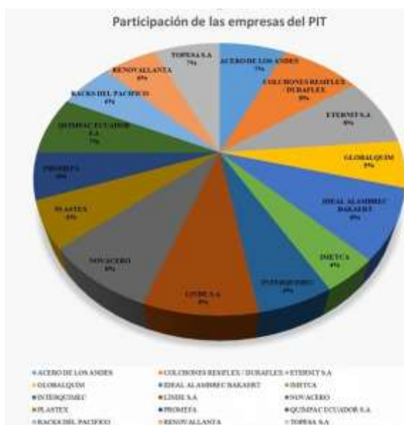
Ilustración 8 Participación de RS en las empresas de PIT

En la anterior ilustración se presenta de manera global a las empresas que forman parte el Parque Industrial Turubamba y su participación en el desarrollo de la Responsabilidad Social.