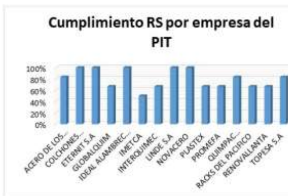
Ilustración 7 Cumplimiento porcentual por cada empresa del PIT

En la ilustración anterior se evidencia que las organizaciones con el mayor cumplimiento de obligaciones para con el medio ambiente, las leyes, la sociedad y la ética son las empresas Resiflex, Novacero, Ideal Alambrec, Eternit y Linde S.A con un 100% de cumplimiento en los factores de Responsabilidad Social; seguido por Acero de los Andes y Quinpac Ecuador S.A y Topesa con un 80%; mientras que las empresas Globalquim, Interquimec y Renovallanta cumplen un porcentaje variable entre el 60%-70%. En contraste, las empresas Imetca, Plastex, Promefa, Racks del Pacífico y Renovallanta ejecutan únicamente un cumplimiento ubicado entre el 30% a