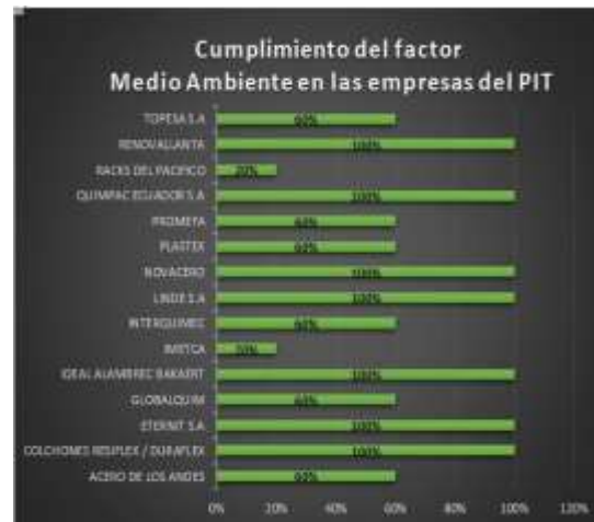
Ilustración 4 Cumplimiento porcentual factor ambiental de las empresas del PIT

Para dinamizar los resultados encontrados se plantea de manera gráfica porcentual el cumplimiento de Responsabilidad Social de las industrias que confirman el Parque Industrial Turubamba distinguidas por factores independientes: