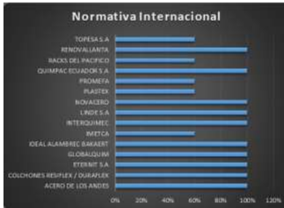
Ilustración 5 Cumplimiento porcentual factor normativa internacional de las empresas del PIT

ambiental lo que ocasiona el incumplimiento de este factor.