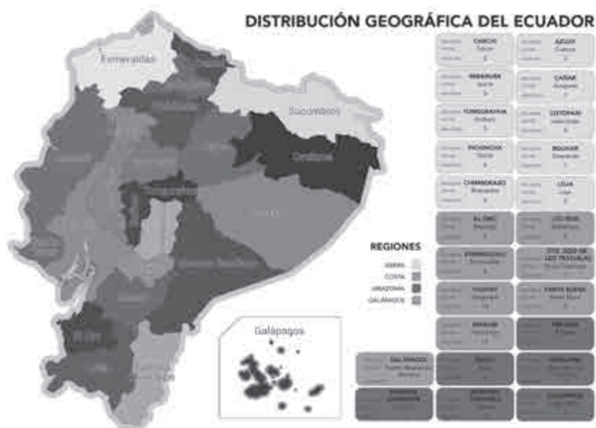
Mapa 1 Distribución geográfica del Ecuador

En este sentido, se construyeron 53 indicadores de evaluación, unos obligatorios que son tomados literalmente de las leyes antes mencionadas y otros voluntarios que responden la exigencia de información que se considera necesaria para la participación ciudadana.